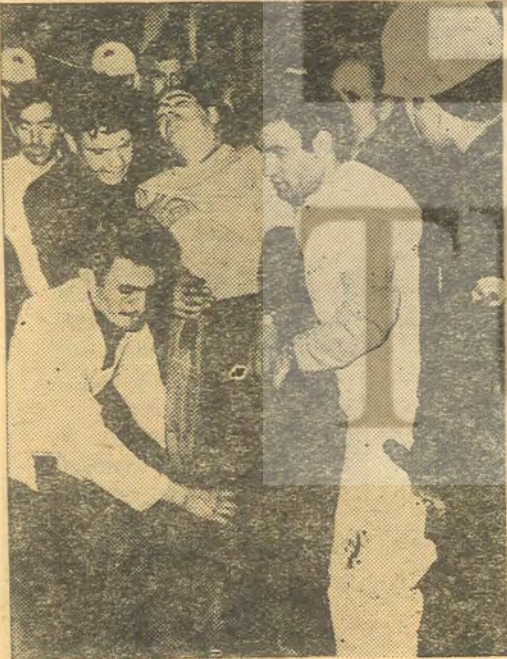
İşte bir yaralı — Ya bıçakla, ya silâhla yaralı —

Bir başka yürüyüş daha başlamıştı aynı anlarda. Bu da Dolmabahçe Camii'nden Taksim'e doğruyd. 171 Sayılı kanunun 7. maddesine aykırıydı. Yürüyüşün yanında, taş, sopa, bıçak, silâh, molotof kokteyli vardı. 171 Sayılı Kanunun 13. maddesinin b bendine aykırıydı. Binlerce polis vardı ve ses çıkarmıyorlardı. Tekbirlerle yüründü. Taksim meydanına gelindi. Ve Taksim ge-