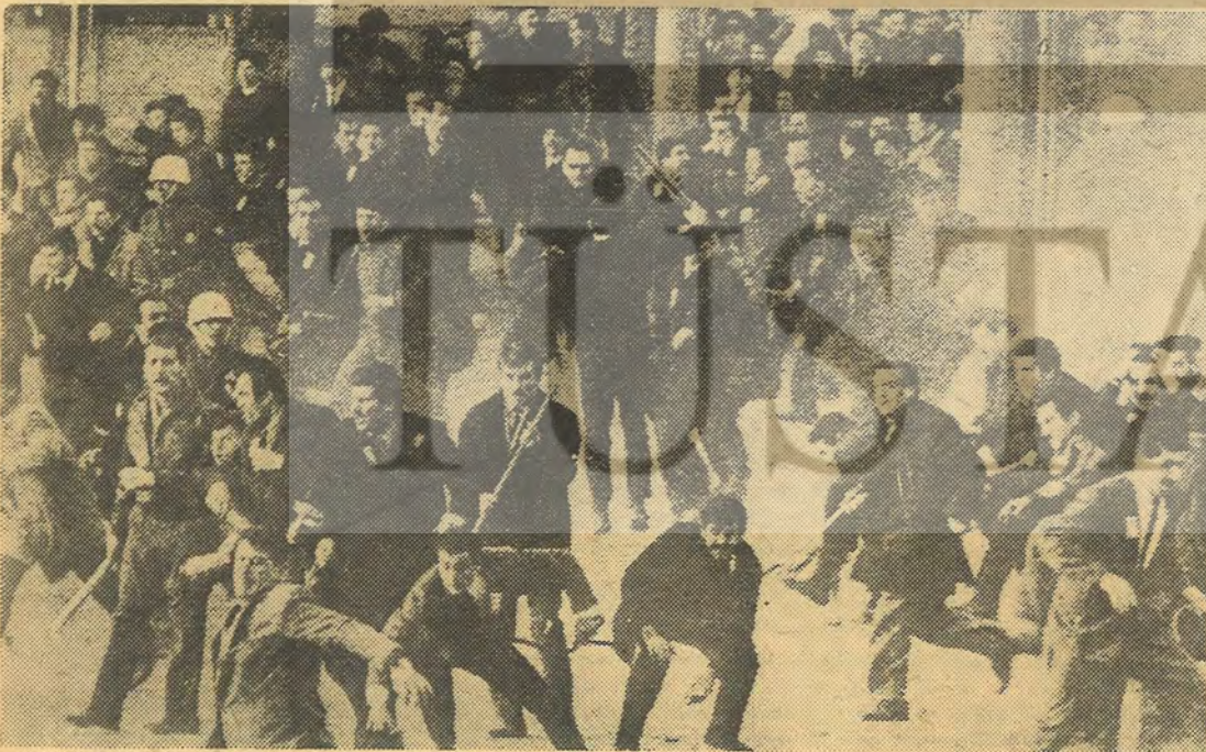
Kanlı Pazar'dan bir görünüş

Ancak aşağılık cinayeti Pop Gaponlar da hazırlamış olsa, sonunda millete sırtlan yüzünü gösteren Finans-kapital pişman olacaktır. Yaşayışı durdurabiliyorlar mı? Bir tek insan yaşadıkça: Kurtuluş Savaşı yürüyecektir.