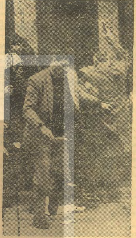
Bu katliam Müslüman Türkiye uğruna

Taksim meydanının Cihad için örgütlenmiş yobazlar tarafından erken saatlerde işgal edildiğini, bunların gayet disiplinli bir şekilde hareket ettiklerini, olayların bin kadar Toplum Polisi ve 66. Tümeğe bağlı tam teçhizatlı askerlerin gözü önünde cereyan ettiğini, saldırganların Polis ve Tural lehinde gösterilerde bulunduğunu, yürüyüşün Hürriyet Meydanı'ndan Taksim'e kadar geçen faslı, pankart ve dövizlerdeki anti-emperyalist sloganları, tertibat alanlara sanki gelenlere saldıracak olan engellenmiyerek, serbest bırakılsın» dendiğini ve polis şeflerinin otomobillerinde polis olmadıkları anlaşılan kimsele-