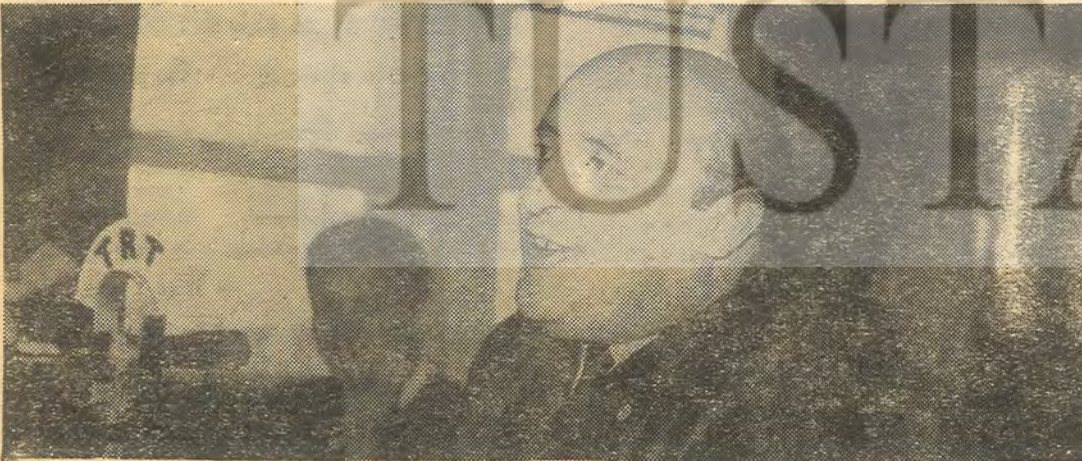
DEMİREL — Ordunun Hamisi! —