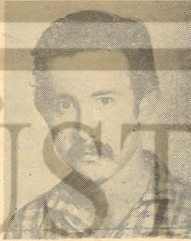
YUSUF KÜPELİ (FKF Genel Başkanı)

Bugüne kadar oportünistlerin etkisi altın-