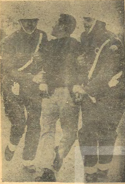
Toplum Polisi bir işçiyi götürüyor — Asıl görev işçiyeye karşı —