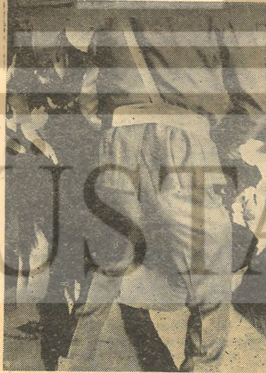
Toplum Polisi görev başında!

İşgalin hemen ardından fabrikanın Amerikalı müdürü Ankara'ya telgraf çeker «İşçiler fab-