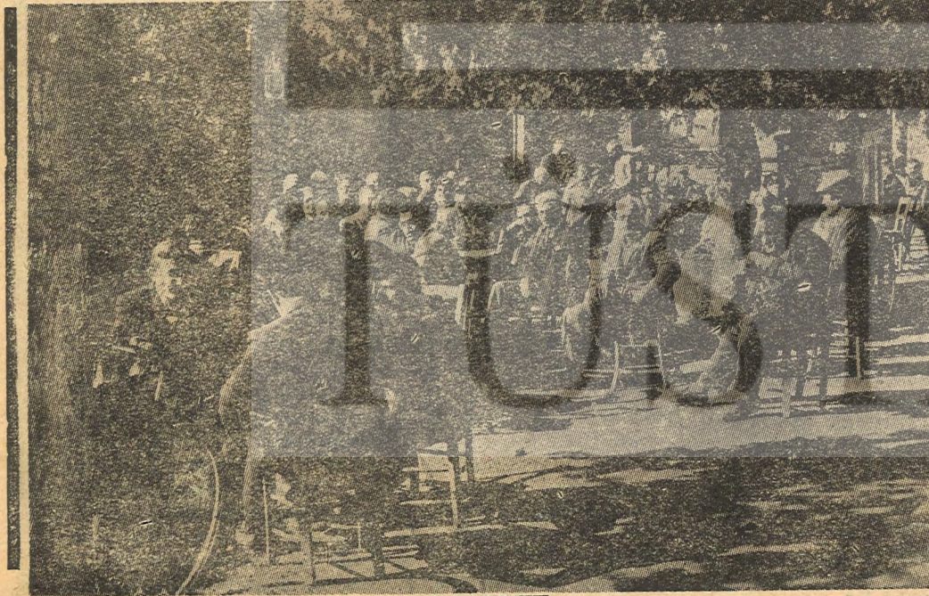
Yan sayfada üstte maden arazisinin girişi görülmektedir.

Bunun yanında, ayaküstü konuşmalar ve kahve sohbetleri sırasında, hem de maddi sıkıntısı ve bir