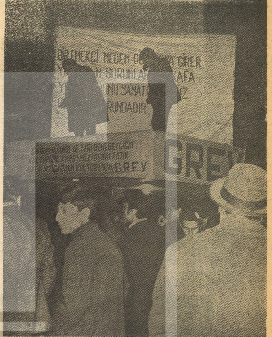
AST Esas şimd. açıklanmamıştır!

İşbirlikçi iktidarın sıkı ve direkt olarak politik ve mali denetimi altında bulunan tiyatro kurumlarında, kültür cephesinde girişilen devrimci eylemlerle; kısaca vadede, elle tutulur gözle görülür biçimde bir nitelik değişiminin gerçekleştirilmesi imkânı yoktur. Zira, bu kurumlar üzerinde farklı derecelerde de olsa, işbirlikçi iktidarın sıkı ve direkt olarak kontrolü söz konusudur. V: bu kurumların nitelik değişimleri ancak «MİLLİ DEMOKRATİK BİR İKTİDARIN GERÇEKLEŞ