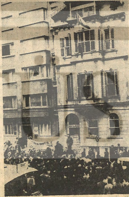
3. Gün Ata'nın evi önünde saygı duruşu

İşte böyle bir dönemdeyiz. Ve AP iktidarı açıkça polis şeflerinin kumandasında devrimci gençliğe saldırıyor. Üniversitenin devrimcilerin kalesi olması sebebiyle onu hedef seçiyor.