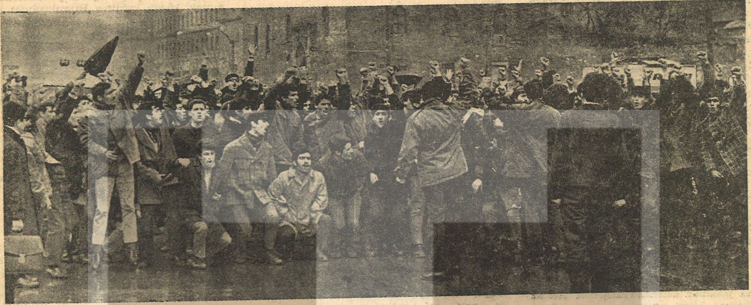
2. Gün, devrimci gençler rektörlükbinasının a yürüyorlar parola: Bağımsız Türkiye

Halkımızın devrimci mücadelesi karşısında Amerikan emperyalizminin işbirlikçisi AP iktidarı bir buhran içindedir. Emperyalizme bağımlı ve kısır bir ekonomik düzen içersinde, gerici parlamentarizmin, işbirlikçi güçlerin egemenliğini sağlayan durumuna karşılık, bütün halkın devrimci mücadelesi her geçen gün gelişip güçleniyor.