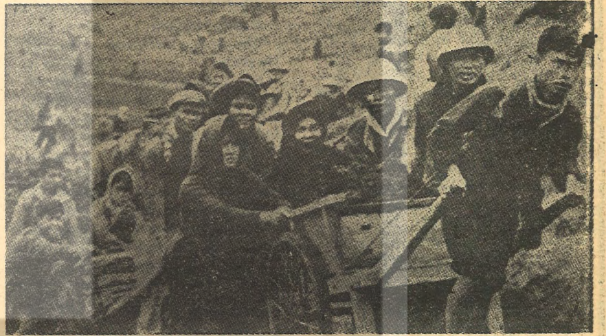
Vietnam halkı her türlü güçlük altında Amerikan emperyalizmine karşı direnmektedir :

Güney Vietnam'daki sendikalar ise, yasak olmasına rağmen grev yapmağa hazırlanıyorlar. Saygon'daki 5.6 bin ulaştırma işçisi başta olmak üzere bir çok Vietnamlı emekçi, savaşı ve savaşın doğurduğu sıkıntı ve adaletsizlikleri protesto etmek amacıyla greve gitmeye karar verdiler. Ancak grev yasak olması dolayısıyla üzerlerine köpeklerin saldırtılacağını bilen işçiler, bir yandan da silâhlanıyorlar ve geerktiğinde polis karşı silâhla karşı koymağa hazırlanıyorlar.