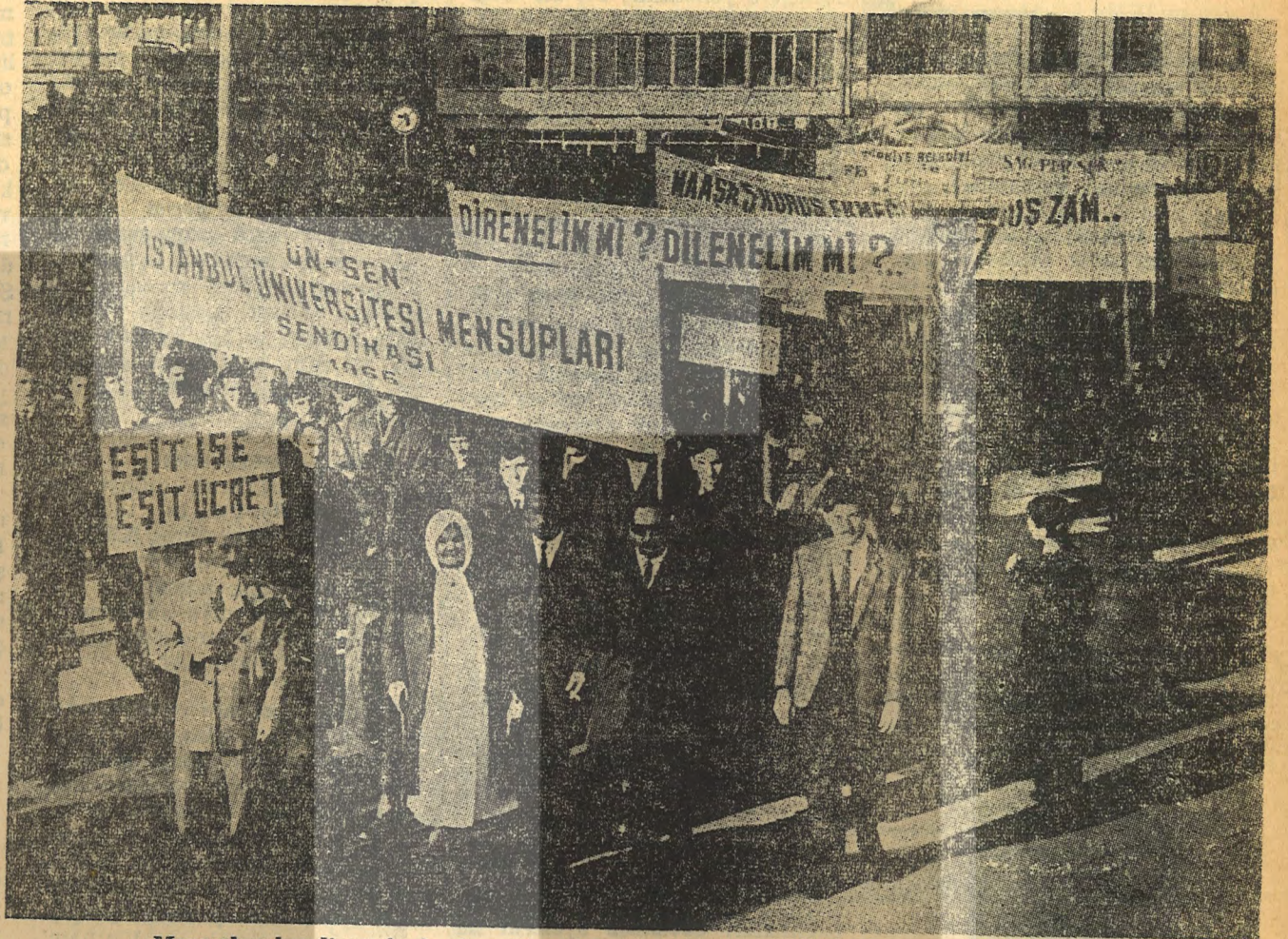
Memurlar, kendi sınıf çıkarları için birleşmelerinin gerektiğinin bilincine varmışlardır.

Bugün memur ve hizmetlinin içinde bulunduğu durum hiçte gösterilmeye çalışıldığı gibi refah