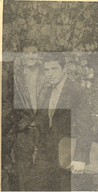
Taylan Özgür Lisede

«Bütün gençlik olarak birleşmeliyiz ve kendimizi kırdırmamalıyız. Tabandan hiç bir zaman kopmamalıyız. Tabandan kopuk örgütsüz hareketler bir yere varmaz bizi. İlk Federasyon olayların