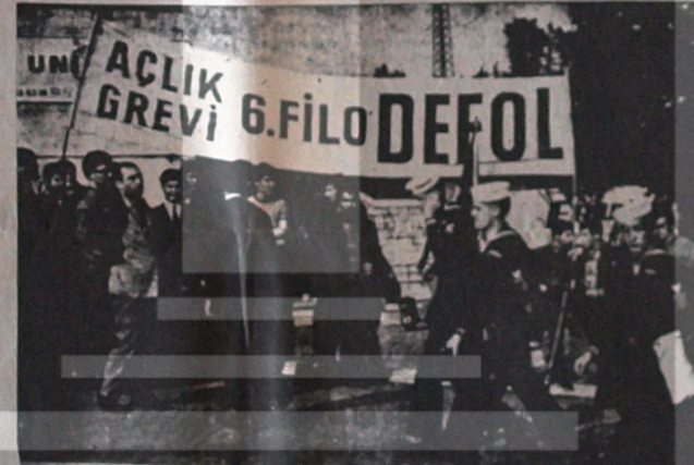
Resim: Antiemperyalist gençler n 6. fileye karşı emeller devretilebilir

leniyor. Bu gençliğin emellerine cevap verilmemesi, emperyalizmin bir sonucu olarak ortaya çıkmıştır. Gençliğin emellerine cevap verilmemesi, emperyalizmin bir sonucu olarak ortaya çıkmıştır.