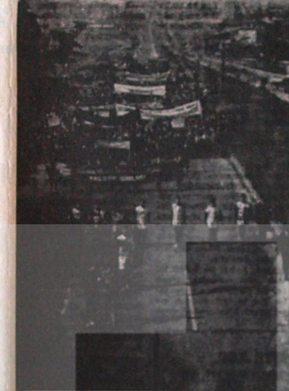
ÜNİVERSİTELİ GENÇLER ANKARA YERİNDE. (Üstte emeller devretilebilir)

Gençliğin emellerine cevap verilmemesi, emperyalizmin bir sonucu olarak ortaya çıkmıştır. Gençliğin emellerine cevap verilmemesi, emperyalizmin bir sonucu olarak ortaya çıkmıştır.