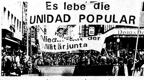
YAŞASIN HALK CEPHESİ, KAHROLSUN İSKERİ CUNTA! DİYEN HANGİRLİ İŞÇİLER ŞİLİ HALKIYLA DAYANIŞMADA!

Avrupa'da galılaşmakta olan Türkiye'li işçilerde bulundukları şehirlerdeki dayanışma içinde aktif ola rak yer almaktadırlar. Avrupa Türkü yğli Populular Federasyonu, bir bildiri ile askeri darbeyi protesto etti, Şili Halkının savaşını bel-irtti.