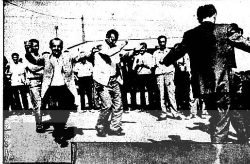
İNANÇLI ERDEMİR İŞÇİLERİNİN AZIM VE SEVINÇLE GREVLERİNİ YÜRÜTMELERİ BAŞARI ERDEMİR İŞÇİLERİNİN