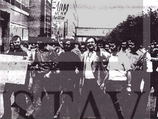
SAAT BAŞINA 60 KURUŞ ZAM ALAN İŞÇİLERİMİZ DİĞER İŞÇİLERLE BİRLİKTE

nin, bir mebusun çocukçu çırak o - kuluna giteydi hemen kanunlar değışverirdi. Gerçi bakan çocukçu pek çırak olmaz ya! Bu durum önce Batı Berlinde protesto edildi. Çırak okuluna giden Türk gençleri kendi arala rında imza toplayarak bu haklı isteklerini Alman sendikalar birliği DGB'ye duyurdular. Bonn biyüğü elçilerine, çalısma ateş - lililerine durumlarını bildirdi - ler. Çirak hep Ankara'dan yazmış ge - lecek diye genç kardeşlerimizi atlatıyorlar. Fakat gençler mü - dadelilerinde sabırlı ve ısrar - lıdırılar. Haklı davamızı kazanın caya kadar mücadeleyle devam e - deceğiz demekteler. Gençlere a - bu mücadelelerinde vulleride deg tek olmaktadır. Velliler, hükümet çocuklarımızın askerlik tecili için kararnameyi çıkartmalıdır. aksi takdirde çocuklarımızın iş - tikballyle oynanıyor" demekte - dirlir.