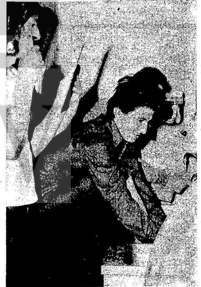
Aynı lavobada traş olmak, ayak yıkamak, çamaşır yıkamak zorunda kalan işçilerimiz.

Yurt müdürü, yurttaki eksiklikleri görüpte düzeltilmesini isteyen işçileri yurttan atmak için harekete geçmişse de işçilerin topluca direniş ve protesto eylemlerini önleyememiştir.