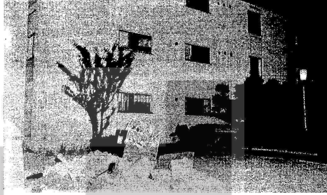
Önünde çöp yığını bulunan yurt binası

Günde 8 saat çalışıp, eve gelince bir dinlenmek gelir insanın içine, şöyle bir duş alıp Türkiye'yi, geride bıraktıklarına düşünmek.