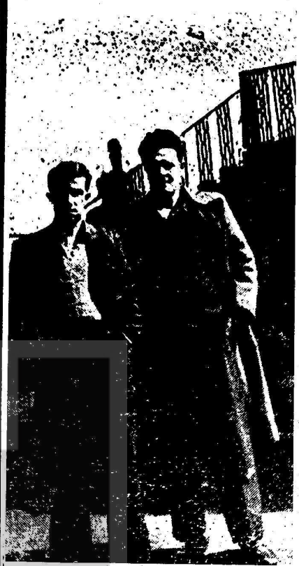
Nazım Hikmet ve Orhan Kemal Bursa hapisanesinde yanyana

Pariste Fransa Türk öğrenci birliği ile İngiltere Türk öğrenci birliği ve Avrupanın diğer şehirlerinde ATTF ve örgütleri Nazımın ölümünün 10. yılı münasebetiyle, Nazımın hayatını ve mücadelesini Türkiye işçi ve öğrencilere tanıtan toplantılar tertip etmişlerdir.