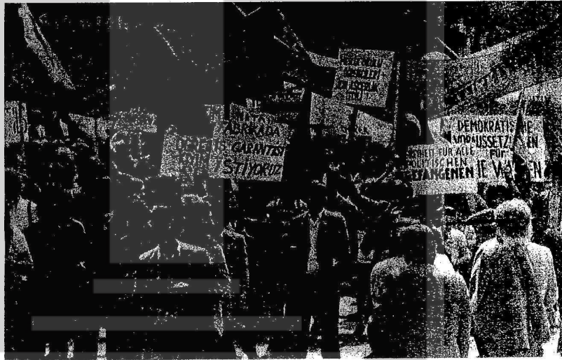
BATİBERLİNDEKİ BİR MAYIS YÜRÜYÜŞÜNE KATILAN VE BİR MAYIS BAYRAMINI KUTLAYAN İŞÇİLER

1 Mayıs günü "Barış Demokrasi ve Sosyalizm için - Tekellerin İktidarına ve gericiliğe Karşı" temel şiarı altında 100 binin üstünde insan yürüdü. Mitinge binlerce Türkiyeli işçide katıldı. İşçilerimiz Türk bayrakları ve kırmızı işçi bayrakla-