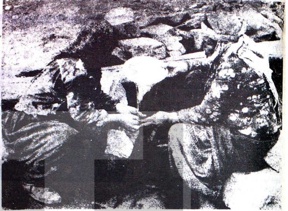
DOĞU ANADOLUDA TERK EDİLMİS VATANDASLARIMIZ

Karakollarda çirilçıplak soydurulan kadınlara yapılan hakaretin ve tenasül uzuvlarına ip takılarak işkençe edilen erkeklerin aç susuz, okulsuz, hasta