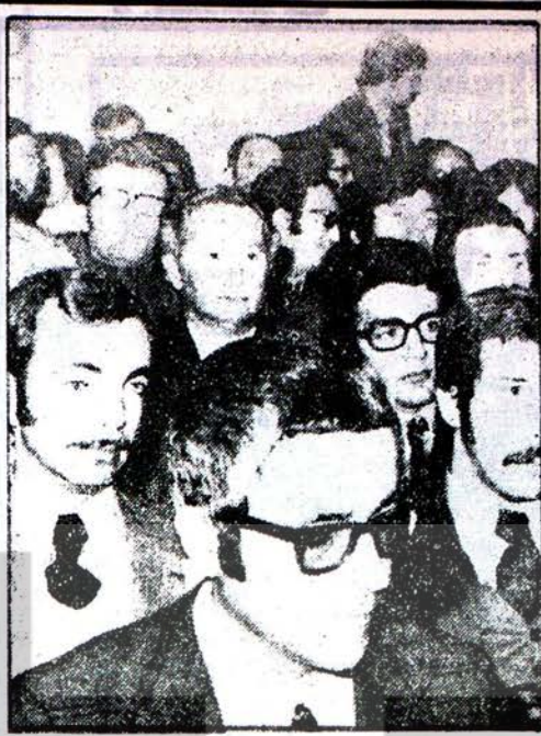
MİMARLAR ODASI GENEL KURULU

İşçi sınıfının liderleri bu gibi burjuva ajanları karşısında son derece uyanık olmalıdır. İşçi sınıfının, bu çeşit sınıf düşmanlarını kendi sendikalarında barındırmaya artık tahammülü yoktur.