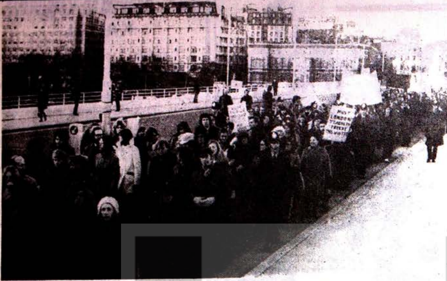
Londra'da, maaşlarına zamm isteyen öğretmenlerin protesto yürüyüşü görülüyor.

İsrail askerleri çarşamba gecesi kuzey Lübnan'daki iki mülteci kampına baskın yapmışlar ve aralarında çocuk ve kadınların bulunduğu 30 kişiyi öldürmüşlerdir.