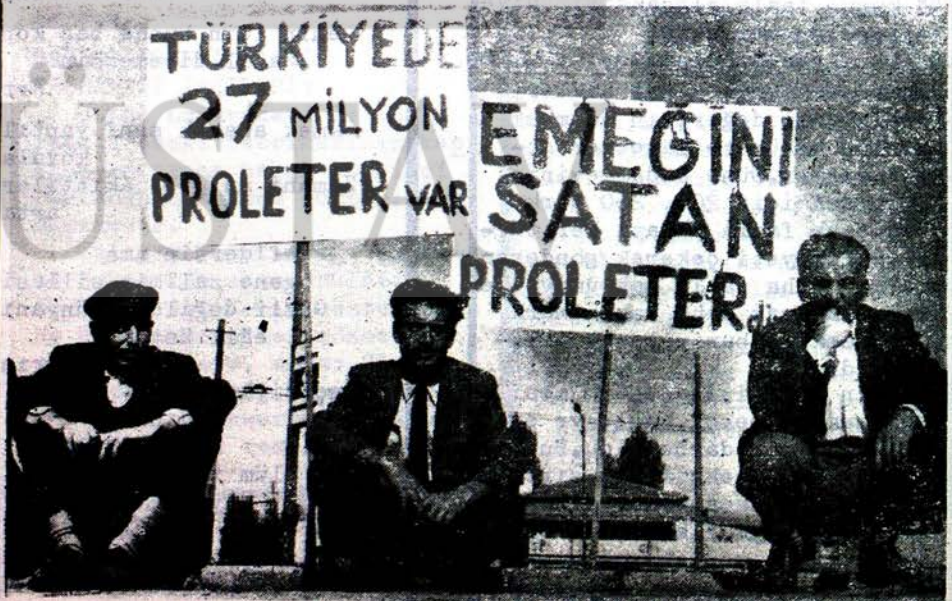
Yabancı sermayeye karşı miting