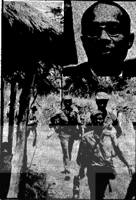
Bağımsızlık savaşı veren Gine'liler ve AMILCAR CABRAL

Tüm bu kanlı cinayetler saldırılar Portekiz sömürgeciliğinin yüzünü bütün dünyaya açığa sermekte, Afrika halklarının haklı bağımsızlık savaşları gün geçtikçe daha çok taraftar kazanmaktadır.