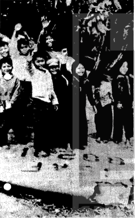
KENDİLERİNE HER GÜN TONLARCA BOMBA ATARAK ÖLÜM SAĞAN AMERİKAN B 52 UÇAĞI DÜŞÜRÜLDÜK- TEN SONRA ÜSTÜNDE SEVİNÇLİ VIETNAMLI ÇOCUKLAR