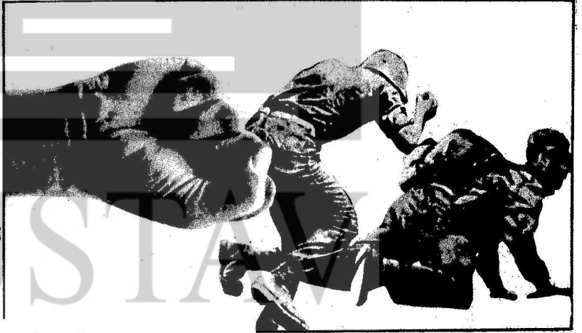
AMERİKA VIETNAM'DAN DEF OL!

kuvvetlerin konumunu tesbit edecek,Saygon ve devrimci hükümet kuvvetleri kontrol ettikleri yerleri muhafaza edeceklerdir.