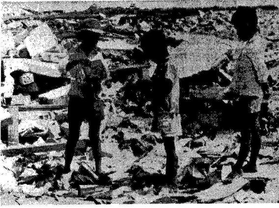
AMERİKAN UÇAKLARININ HEDEFLERİNDEN BİRİ OKULLAR VE ÇOCUKLARDI