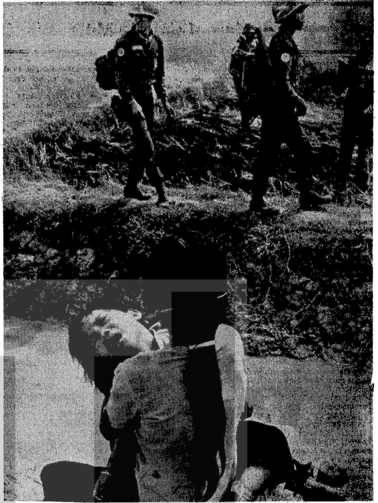
VIETNAMDA AMERİKALILAR MAL,CAN,ÇOCUK BİRŞEY TANIMİYORLARDI!