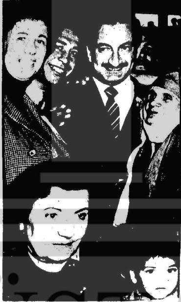
ECEVİT YENİ PARTİ ÜYELERİYLE

Demokratik çevrelerin direnişi devam etmektedir.