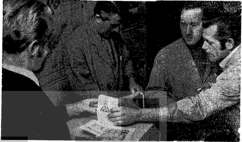
Resimde grev oylaması yapan İG Metal'li işçiler

Federal Almanya kimya sendika sı Nürnbergde yabancı sendika ve işyeri temsilcileriyle bir seminer tertiplemiştir.Seminer de yabancı işçilerin problemleri incelenmiştir. Özellikle Federal Almanya radyo ve televizyonlarında yabancı işçiler le ilgili programların üzerin de durulmuş bu yayınların art tırılması ve kalitesinin düzel tilmesi istenmiştir.