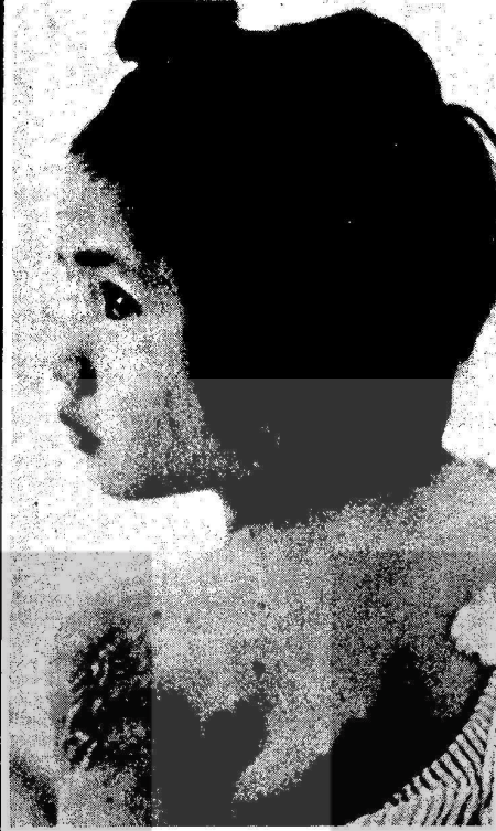
AMERİKAN NAPALM BOMBASI KURBANLARINDAN BİR ÇOCUK

Geçtiğimiz hafta sonundan beri bizzat Nixon'un emriyle özel stratejik önemi olan bombardıman uçakları Vietnam Demokratik Cumhuriyetine karşı ağır hücumlara geçmiştir. Bu bombardımanlar, bir gecede Hanoi'de 100 den fazla sivilin ölmesine sebep olmuştur. ABD nin harbi şiddetlendirici ve barışa hergün yeni engeller koyan tutumu, gün geçtikçe genişleyen bir protestoyla karşılanmaktadır. Nitekim, Belçika, Norveç, Kanada, Hollanda ve Danimarka gibi NATO ülkelerinin hükümetleri dahi Nixon Hükümetinin bu katliamcı ve barışa karşı tutumunu yermişlerdir. Danimarka başbakanı Jørgensen, Washingtona resmi bir protesto göndermiştir.