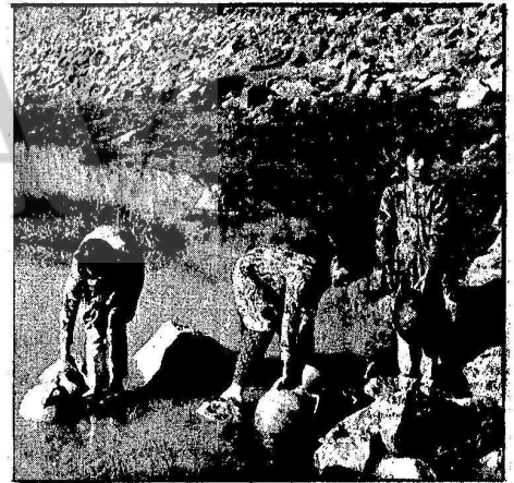
ÇAMURLU VE PİS SULARI İÇMEK ZORUNDA KALANLAR.

Temiz suya hasret kalan köylüler hükümetten su sağlamasını istemişler ancak hiçbir cevap alamamışlardır. Son olarak köylüler "mağarada yaşıyor, fakat susuz yaşamaz. Hayatımız tehlikededir..." demektedirler.