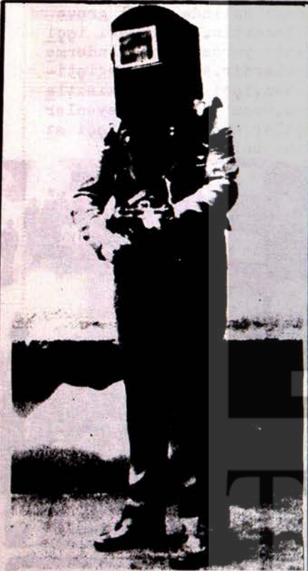
BU POLİS KİME KARŞI BÖYLE SİLAHLANDIRILIYOR ?