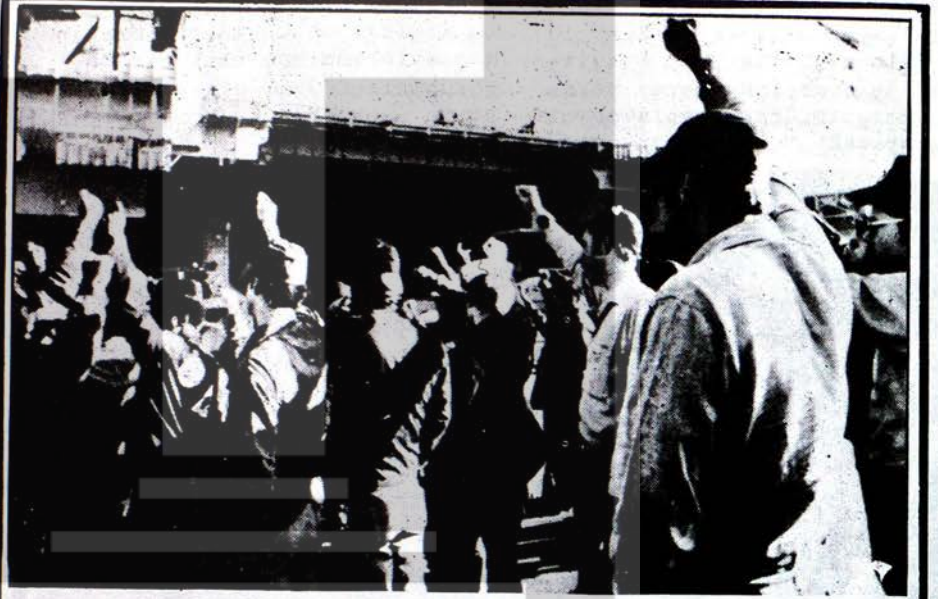
Amerikanın Vietnam harbini yumrukları havada protesto eden amerikan savaş gemisi Constellation bahriyeleri

Salı günü Pariste toplanan, Unesco Genel Kurulu Alman Demokratik Cumhuriyetini oybirliği ile üyelğe kabul etmiştir. DDR Uneskonun 131 inci üyesi olmuştur. Unesco Birleşmiş Milletlere bağlıdır. Ülkeler arasında ilim, eğitim ve kültür alanlarında münasebetlerin arttırılması için çalışan uluslararası bir kuruluştur.