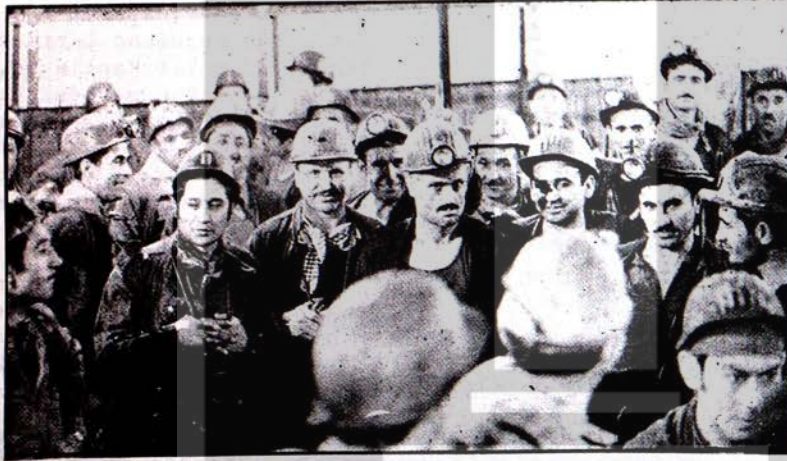
Belçika maden ocaklarında çalışan işçilerimiz

Patronların toplu sözleşmede hile yapmaya kalkmaları üzerine Michreux madeninde çalışan 190 Türk işçisi sendikacının grev çağrısına katılarak bir haftadan beridir işi bırakmışlardır. Grev hala devam etmektedir.