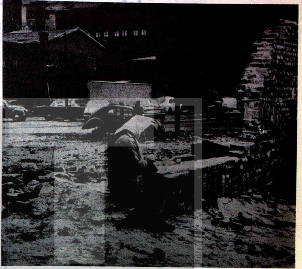
BATI BERLİN'DE ALIŞAGELDİĞİMİZ BİR MANZARA KREUZBERG SEMTİNDE BİR TÜRK KADINI