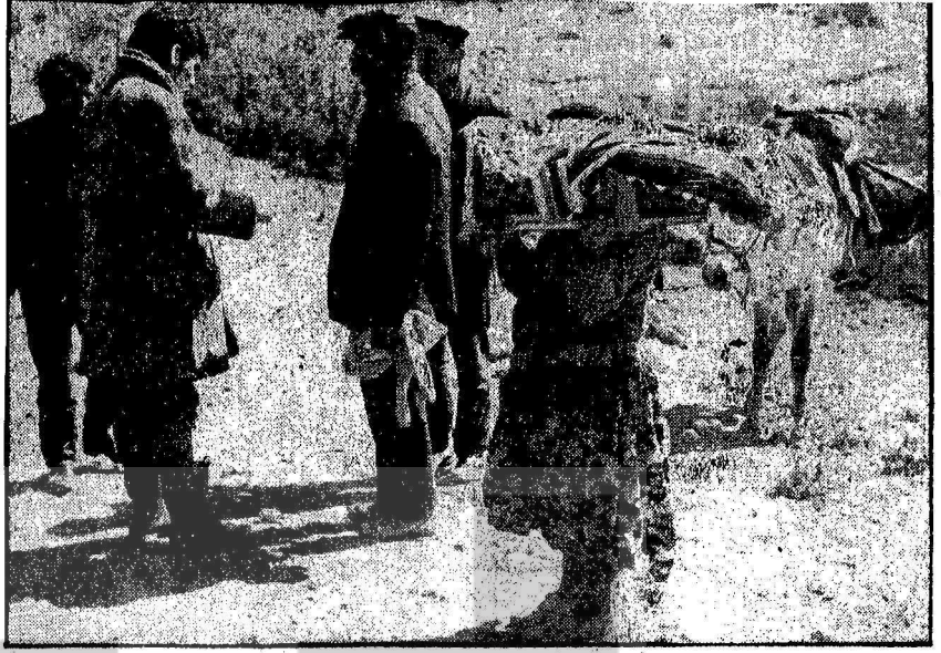
■ Dört buçuk saatlik yoldan böyle taşımıştı, küçük ana bebeğini... Bir o kadarlık daha yolu vardı. Topraktekine ya... Doktora ulaşmak için saatlerce yürümek zorundaydılar...

Şimdiye kadar ve şimdiki burjuva iktidarı tarafından Doğu Anadoludaki halklara üvey evlat muamelesi yapıldı. Kışın açlıktan ot yiyen, Zap sularında boğulan, hastahanesiz, yolsuz okulsuz Doğu Anadolu halkına Ap iktidarı nisan ayı içerisinde de komando ve jandarmalarıyla kırk seneden beri girişilen tehdit kampanyalarından birine daha girişti. Bir gece yarısı silvan ve Batman ilçe merkezleri bölge komutanlığına bağlı helikopterler, motorlu araçlar ve donatılmış jandarma ve komando topçu keşif uçaklarının desteği ile kuşatıldı. Kuşatmayla beraber ilçe merkezine giren birlikler hiç arama yetkisi olmadan, şahıs ve mesken masunuyetini çigneyerek yüzlerce evi didik deşik ettiler. Yataklarından kaldırılıp özel kamplara alınan erkeklerle görülmemiş işğence yapıldı. Kadınlar ve kızlar evlerden alınarak polis ve jandarma karakollarına götürüldü, işkence ile birlikte ağır hakaretlere maruz bırakıldılar. AP iktidarının Türk halkına saldırttığı bu özel komando birlikleri, adeta işgal edilmiş düşman topraklarında ki işgalci kuvvetler gibi davranmaktadırlar. Sözde "Doğudaki asayişin korunması için" girişilen bu faşist saldırı, bir yandan masum Doğu Anadolu halkına göz dağı vermek bir yandan da can, mal, ırz düşmanı yurguncu ve kaçakçı toprak ağalarının ve onların yataklık ettiği eşkiyaların asayişsizliğini korumak içindir. Doğuda girişilen bu terör Türkiye'de yerleşmekte olan faşizmin bir parçasıdır. Bütün ilerici güçler faşizme karşı birleşmelidir.