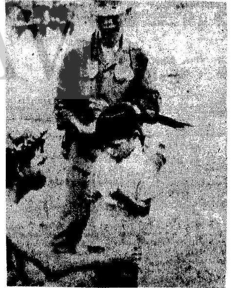
6 AMERİKADA PROTESTO YÜRÜYÜŞÜ YAPAN GENÇLERE ASKERLER SÜNGÜ ÇEKTI