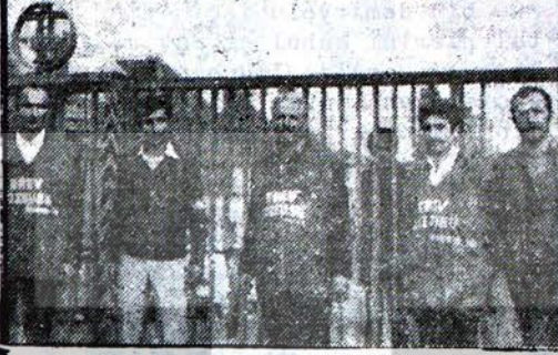
Grev gözcüsü yiğit işçiler...