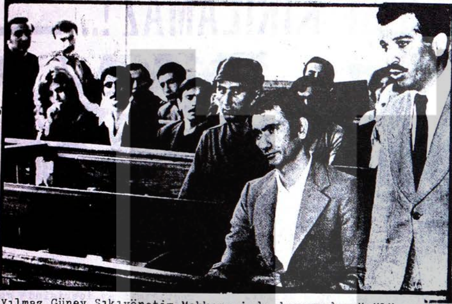
Yılmaz Güney Sıkıyönetim Mahkemesinde duruşmada görülüyor

şılık, hükümetin % 15 lik teklifinin işçiyi üç yıl önceki koşullara itmek olduğu" belirtilmektedir. Bu konu ile ilgili olarak Tekel-İş Sendikasının Tekel iş yerlerinde alacağı bir grev kararına Petrol-İş sendikası da katılacaktır.