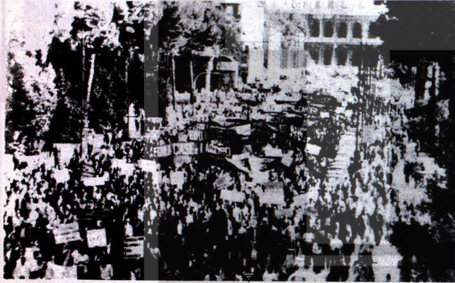
Roma'da 10000 yapı işçisinin katıldığı, zam isteğiyle düzenlenen muazzam yürüyüşün bir görünüşü.

Bu arada İtalyan Hükümeti'nde 200 bin demiryolu işçisinin taleplerini kabul etmiştir. Salı günü Roma'da 300 bin yapı işçisi yeni toplu sözleşme için büyük bir yürüyüş yapmışlardır.