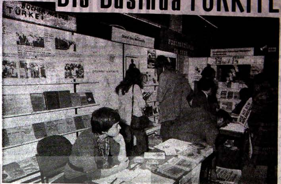
Einen eigenen Stand hatte der Messer auf der Frankfurter Buchmesse errichtet. Gezeigt wurden Bücher und Zeitschriften aus terroristischen Militärdiktaturen (auf unserem Foto Iran und Türkei), Untergrundliteratur, deren Erscheinen wegen „staatsgefährdender“ Texte von den Behörden der jeweiligen Länder unterdrückt wird.

Türk Toplumcular Ocağı 1 Berlin 21 Turm Str.20 ye müracaat edebilirsiniz.