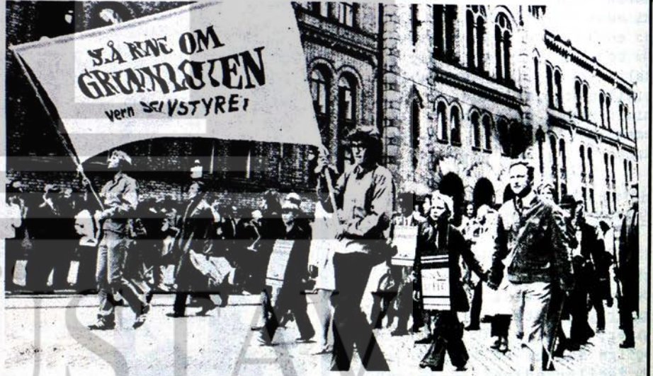
NORVEÇ HALKININ ÇOGUNLUĞU YAPILAN HALK OYLAMASINDA ORTAK PAZARA KARŞI ÇIKTI. FOTOĞRAFTA REFERANDUM ÖNCESİNDE DÜZENLENEN "ORTAK PAZARA HAYIR" GÖSTERİLERİNDEN BİRİ GÖRÜLÜYOR.

işleri Bakanı Gromiko'nun Genel Kurul'da yaptığı konuşma ve önerdiği teklifler büyük bir ilgiyle izlenmiştir. Gromiko'nun Genel Kurul'a sunduğu tekliflerden bazıları şunlardır: "Amerika'nın Vietnam harbine son vermesi. Ortadoğu sorununun barışçı ve haklıdan yana bir şekilde çözülmesi. Dünyaya Silahsızlanma Konferansını toplamak suretiyle, silahlanmayı önleme yolunda çaba harcanması. Kolonyalizmin kalıntılarına son verilmesi." Gromiko gelişen şartların sürekli bir barış sistemi kurmağa imkan hazırladığını belirterek, Birleşmiş Milletler'in zaten bu amaçla kurulmuş olduğunu söylemiştir.