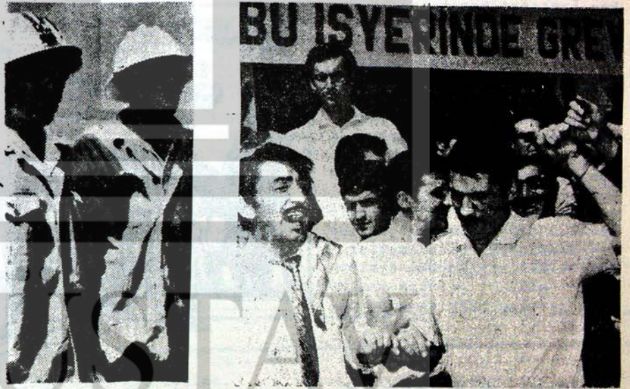
İşçilerin grev halayını kimse durduramaz.

GIDA-İŞ sendikası Söke Değirmencilik Un fabrikasında işverenin sendikandan isteklerini kabule yanaşmaması üzerine greve girme kararı almıştır.