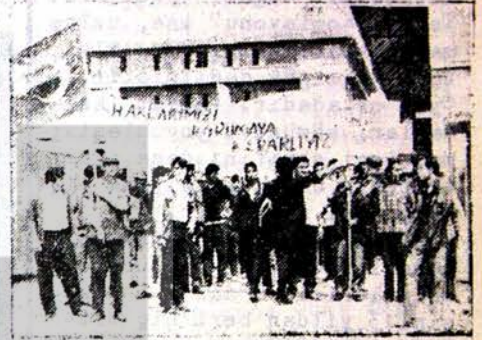
İşçiler kazanılmış haklarını korumaya karardır.