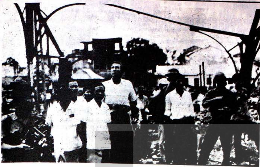
Amerika'nın harp cinayetlerini inceleyen uluslararası komisyon, Amerikan bombalarının Hayfong şehrinde bıraktığı eserleri geziyor...