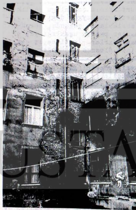
Türklerin oturdukları Naunynstrasse'deki evlerden biri

Batıberlin'in Kreuzberg semtindeki NAUINSTRASSE'de oturan Türkiye'li kiracılar ev sahiplerine ve şirketlere karşı haklarını koruyabilmek için, "Türk Kiracıları Yardımlaşma Derneği" ni kurmuşlardır. Batıberlin'in Kreuzberg semti özellikle Naunyn caddesi Türkiye'li işçilerin yoğun olarak oturdukları bir işçi mahallesidir. Burada oturanların %60 kadarı Türktür. Bu semtteki işçilerin oturduğu evlerin hemen hemen tümü abrißhäuser (abrishoyzer) denilen yakında yıkılacak, eski, köhne evlerdir. Almanlar yıkılacakları için bu evlerden çıkmakta, çaresiz durumda olan işçileri yıkılacak evdir filan demeden buralara taşınmaktadırlar... Ev sahipleri ve şirketler şimdi Naunyn caddesindeki 8, 10, 12 ve 14 numaralı evleri yıkmak istiyorlar. Bu evlerde oturmakta olan Alman kiracılara şirketler yeni ev verirlerken, Türkiye'li kiracılara yeni ev verilmemekte, yine altı ay ya da bir yıl sonra yıkılacak köhne, terkedilmiş evleri göstermektedirler. Kendilerini haklı çıkartmak için de ev şirketleri "Türk kiracılar ucuş olan eski evleri tercih etmektedirler, pahalıca olan yeni evlere taşınmak istemiyorlar" demektedirler. Halbuki Türkiye'li kiracılar yaptıkları toplantıda bunun yalan olduğunu, biraz pahalı da olsa, yeni evlere taşınmak