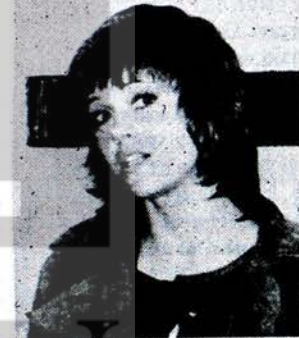
JANE FONDA HANOY'DA

Kuba cumhurbaşkanı ve komünist partisi birinci sekreteri Fidel Kastro'nun sosyalist ülkeleri ziyaretinden sonra Kubanın Sosyalist Ülkeler Ekonomi Birliğine üye olduğu açıklanmıştır. Böylece Kuba ve Kuba ile birlikte Sosyalist Ülkeler Birliği daha da güçlenmektedir.