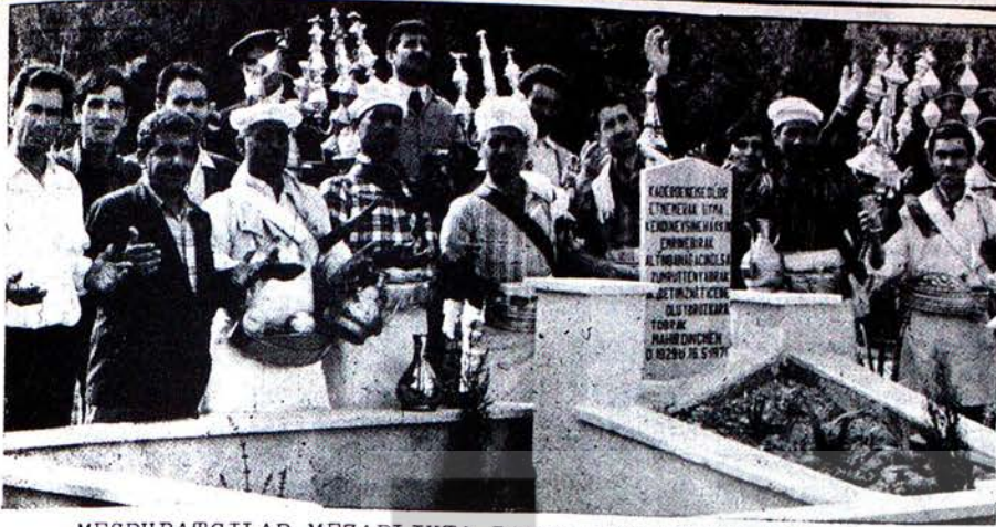
MEŞRUBATÇILAR MEZARLIKTAKI BASIN TOPLANTISI YAPILAR

Belediyenin seyyar satıcılara meşrubat satmayı yasaklanmasını asri mezarlıkta protesto eden meşrubatçılar, "Böyle bir hazin basın toplantısına, böyle yer gerek", "Belediye bizi, çoğumuz çocuğumuzla açlığa mahkum ediyor. Sebep birkaç nüfuzlu şahsın kurduğu meyva suyu tesisleri. Nafakamızı ortadan kaldırmak istiyorlar... Binlerce insanın açlığa mahkum edildiği açıklanan bu basın toplantısı için en uygun