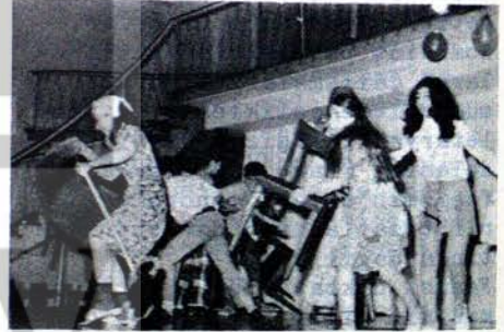
ÖĞRETMENLER GECESİNDE ÇOCUKLAR TARAFINDAN VERİLEN MÜZİKLİ PİYESTEN BİR SAHNE

Bu arada Alman Öğretmenler Sendikasına üye, yabancı öğretmenler komisyonu da bu kampanyayı desteklemiş, çıkardığı Türkçe bildirilerle, Türkiye'li işçilerin desteğini sağlamaya çalışmıştır.