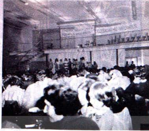
Federal Almanya ve Batıberlindeki Türkiye'li Öğretmenler Derneğinin düzenlediği Gece