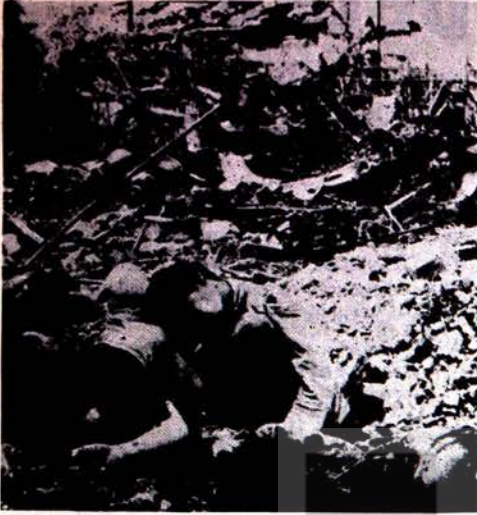
AMERİKAN SALDIRGANLARI, VIETNAMDA GİRDİKLERİ KÖY VE ŞEHİRLERİ BÖYLE YAKIP YIKIYORLAR