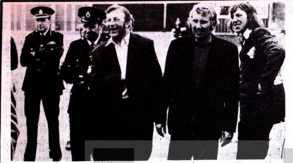
35 000 LİMAN İŞÇİSİNİN DAYANIŞMA GREVİYLE HÜRRIYETLERİNİ