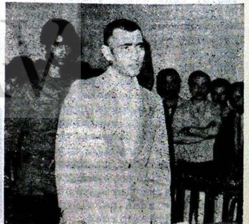
İlerici sinema sanatçısı Yılmaz Güney Duruşmada...

Bu film gizlice, Avrupa'da yapılan, uluslararası, büyük