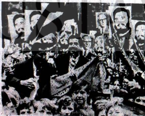
Kastro'nun Demokratik Alman Cumhuriyetinde karşılanması

ninde bütün konularda görüş birliğinde oldukları bildirilmiştir. Küba heyeti daha sonra Çekoslovakya'ya hareket etmiştir.