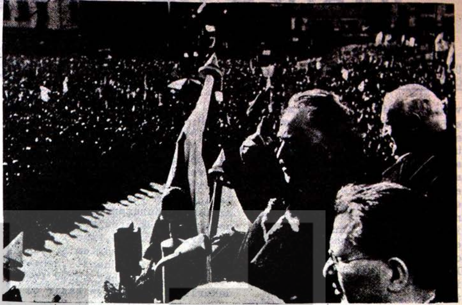
GEORGI DİMİTROF 1948 de SOFYA'DA EMEKÇİ KİTLELERE NİTANEDİYOR!

Faşizmin zaferinin başka bir sebebi de, gençliğin arasına sızmağı başarabilmesiydi. Halbuki sosyal demokrasi gençliği sınıf mücadelesinden uzaklaştırdı, devrimci proleteryaı ise gençliğin eğitimini gereken genişlikte yürütmedi