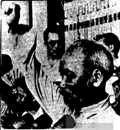
HO Şİ MINH'İN 83. DOĞUM YILDÜNUMÜ KUTLANDI

Vietnam halkı ve dünyanın bütün bağımsızlık ve sosyalizm uğruna mücadele veren insanları, 1969 yılında ölen Ho Şi Minh'in 83. doğum yıldönümünü kutlamışlardır. Ho Şi Minh hayatı boyunca halkının kurtuluşu uğrunda, önce Fransızlara, daha sonra ise Amerikan emperyalistlerine karşı savaşmış, düşmanlarının dahi saygısını kazanmış, dünyanın en büyük kahramanlarından biridir. Bundan yarım asır önce "ezilen halkların ve bütün dünya işçilerinin tek kurtuluş yolu" nun sosyalizm olduğunu görmüş ve bunu gerçekleştirmeyi hayatının tek hedefi olarak kabul etmiştir. Bundan 50 yıl önce dış düşmana karşı mücadelede bü-