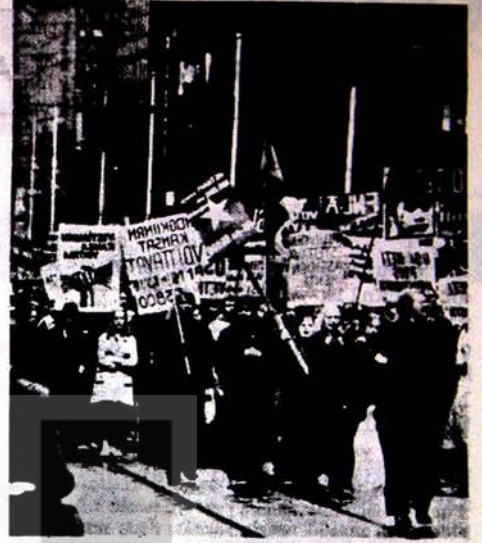
Yukarıda, Amerikan başkenti Washington'da yapılan, Vietnam savaşını protesto eden onbinlerce Amerikalının katıldığı yürüyüşten bir kesit görülüyor.

Nixon, Demokratik Vietnam Cumhuriyeti'ni (Kuzey Vietnam') in bombalanmasını emretmiştir. Her gün 500 ila 1000 kadar Amerikan uçağı, Kuzey Vietnam'ın şehirlerini havadan bombalamakta, Amerikan donanması da, Kuzey Vietnam kıyılarını top ateşine vermektedir. Bütün bu saldırılara rağmen Vietnam halkının mücadelesi her gün daha da kuvvetlenmektedir. Milli Kurtuluş Orduları'nın taarruz geçtiğinden bu yana, düşürülen ve imha edilen Amerikan uçağının sayısı yüzü aşmıştır. Bu arada, Kurtuluş Ordusu, bir Amerikan muhribini batırması ve bir kruvazörü hasara uğratmıştır. Amerikalıların harbi Vietnam laştırma politikası, Vietnam Kurtuluş Ordusunun başarıları ile geçerliliğini kaybetmiştir. Bunu bütün dünya da görmektedir. Kuzey Vietnam'ın bombalanması, gerek Amerika'da, gerek Avrupa'da ve dünyanın her tarafında büyük tepki ile karşılanmıştır. Paris, Londra, Berlin, Washington'da Amerika'nın saldırganlığını protesto eden yürüyüşler yapılmış ve Amerikan bombardımanının hemen kesilmesi istenmiştir. Ayrıca, Amerikan Kongresi de, Nixon' un kendi başına verdiği bombardıman emrini sorumsuzca bir hareket olarak nitelendirmiş ve Nixon'un bu konudaki yetkilerini sınırlamıştır.