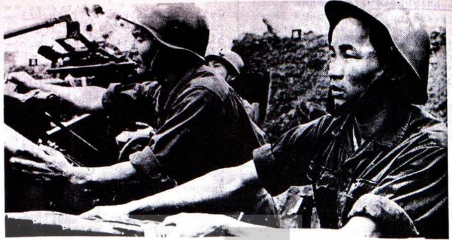
Yukarıda, kurtuluş mücadelesi veren Kuzey Vietnam askerlerinden ikisi silahları başında görülüyor .

NATO, kurulduğu günden beri, emperyalizmin Avrupa'da bütün demokratik ve ilerici akımları bastırmak için sosyalist ülkelere saldırarak için güvendiği ve kullandığı bir araç olmuştur. NATO, Portekiz'deki faşist rejimi her yönden desteklemiş, Yunanistan'da, Türkiye'de de askeri diktanın kuruluşunu planlamış ve idare etmiş, ayrıca, İtalya, Fransa ve Federal Almanya Cumhuriyeti için de bu şekilde benzer planları hazırlamış bir örgüttür. Bu amaçlara hizmet için emperyalistler, Hitler'den, Mussolini'den artakalmış bir sürü faşisti NATO içinde toplamışlar ve bunları en önemli yerlere getirmişlerdir. Birindelli olayı bir kere daha gösteriyor ki, demokrasi ve barıştan yana olan, insan haklarına saygı gösteren herkes için NATO ile mücadele etmek bir görevdir.