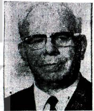
PODGORNİ KİMDİR ?