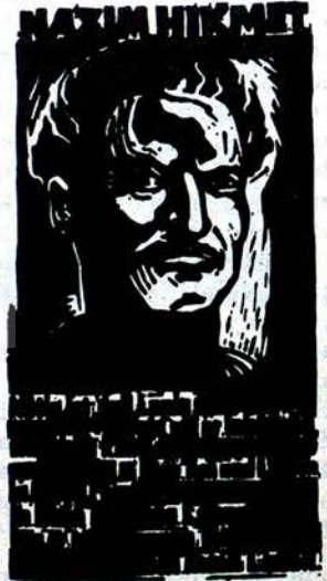
Afişi 5.- Marklık postajlu karşılığında gazetemizden temin edebilirsiniz.

Emperyalizmin savaşçı politikası Adada başarıya ulaşamayacaktır.