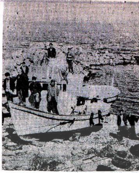
YUKARIDA PROTESTOCU BALIKÇILAR TOPLU HALDE GÖRÜLÜYORLAR

Herşeyin oldu-bittiye getirilip geçiştirildiği, sorumsuz birtakım kişilerin elinde vatandaş parasının akılsızca ve düşünmeden çarçur edildiği Türkiye'de bu örnekler sık rastlanır. Aksaray Geçidi yapımında, yine böyle bir yanlış hesaplamadan, sorumsuzca, milyonlarca vatandaşın parası harcanmıştır. Şehirlerde yol asfaltlama sırasında, asfalt döküldükten sonra döşenilmesinin unutulduğu anlaşılan kanalizasyon boruları döşemek için tekrardan sökülüp atılan yüzbinler değerindeki asfalt ve işgücü, Boğaz Köprüsü yapımında yanlış akıntı hesabı