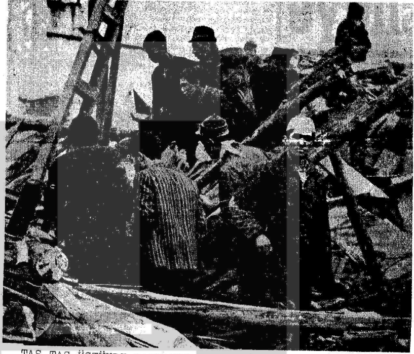
TAŞ TAŞ ÜSTÜNDE KALMAYIP YERLE BİR OLAN GEDİZ ŞEHİRİ

Depremden sonra bastıran yağmur ve karın altında titreyenlerin durumu, sevdiklerinin cesetleriyle karşılaşanların feryatları, kaybolan yavrularını arayan anaların çığlıkları, enkaz altından gelen iniltiler ve yanık insan kokusu felaketi dayanılmaz hale getiriyordu. Gediz şehrinin sokakları ölümlerle dolmuş. Bir salgın hastalığı önlemek için ölümler yıkanmadan ve kefenizsiz olarak toprağa verildiler.