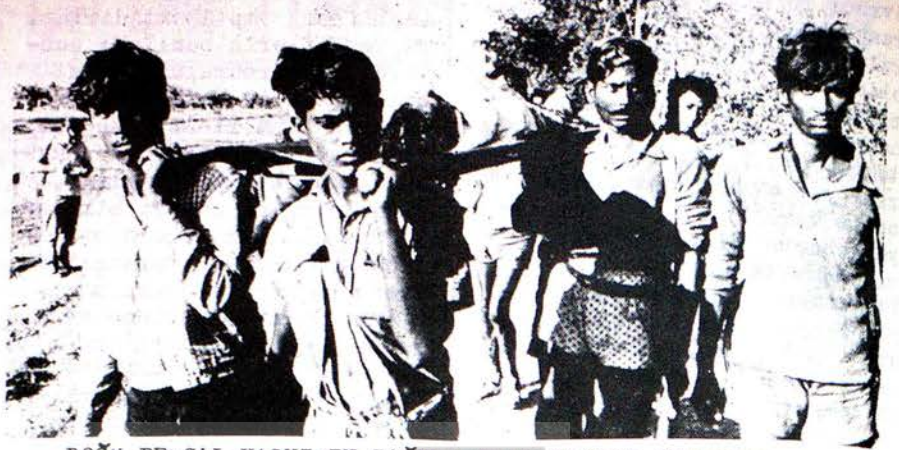
DOĞU BENGAL HALKININ BAĞIMSIZLIK SAVAŞI GÜÇLENİYOR

Kamboçyaya saldıran Saygon kukla ordusu, Kamboçya kurtuluş ordusu karşısında bir kere daha mağlup olmuştur. Amerikan bomba uçaklarının devamlı saldırılarına rağmen saldırganlar, bir adım daha ilerleyemez olmuşlardır. Öte yandan Başkent Pnom Pende Amerikan uşağı hükümetin ordusunun bir bölüğü, kurtuluş Cephesi silahlı güçleri tarafından bozguna uğramış bir halde kaçmıştır.