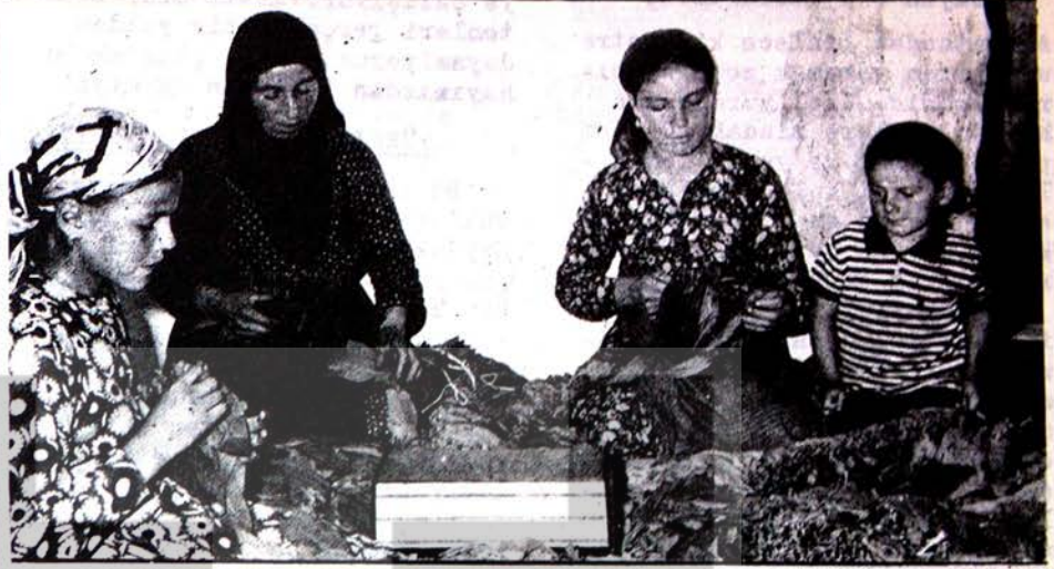
Samsunda tütünleri dizen bayan işçi kardaşlarımız

Daima patronların, ağaların ve emperyalistlerin çıkarlarını koruyan hükümet (hem şimdiki hemde önceki Demirel hükümeti) köylüleri ve çiftçileri ihmal etmişler ve onları tefecilerin sömürü tuzağına teslim etmişlerdir. Bunun bir örneği Kütahya, Afyon, Isparta illerindeki Haşhaş ekiminin Amerikalıların isteği üzerine tamamen yasaklanması ve böylece binlerce ailenin aç sefil kalması idi. İkinci örnek karadenizli köylülerdir. Hükümetin yeteri kadar kredi vermemesi yüzünden tefecilere borçlanan köylüler iflas etmeye başlamışlar ve tütün ekimini durdur-