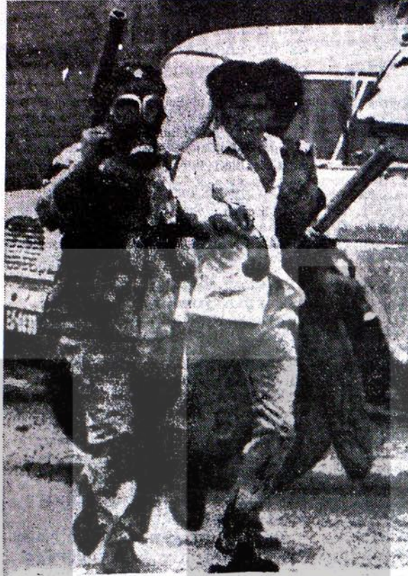
RESİM : ZORLA SANDIK BAŞINA GÖTÜRÜLEN BİR G.VİETNAMLI

Şimdi Ortak Pazar bir yandan emperyalist Japon HİTAÇİ şirketi öteyandan kıran kırana bir rekabet savaşına girişmiş bulunmaktadır. Diğer taraftan Avrupa büyük tekelleri Japon mallarının Avrupaya girmesini önlemek için büyük vergiler dayamaktadırlar.