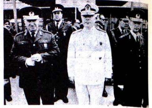
aus: Stern, von 4.7.1971

Son günlerde yüksek rütbeli subaylar yani cuntacı paşalar gazetelere demeçler vermeye başlamışlardır. Erimle Demirel'in çatıştıkları şu günlerde komutanların arkaya demeçler verme ihtiyacı nereden duydukları üzerinde durmak gerekir. Bu demeçler de ortak olan nokta ise her üç komutanın da "komuta heyeti rasında bir fikir ayrılığının olmadığı" üzerinde ısrarla durmalarıdır. Ordu komuta heyeti arasında bir fikir ayrılığı yoktur demekle cuntacı paşalar kamu oyunda ordudan bütün ilerici ve Atatürkçü subayların temizlendiğini kanıkanı uyandırmaya çalışmaktadırlar. Ordu komuta heyeti denince 4 generalin değil ordudaki bütün subayların anlaşılması gerektiğini belirten ve bir amerikan gedikli çavuşunun karşısında el pence divan duran Güler "paşa" orduda komutanlar arasında ilerici subayların sayılarının daha çok yüksek olduğunu gayet iyi bilir. Zira 9 kurmay albayı atmak 4 generali emekliye sefk et-