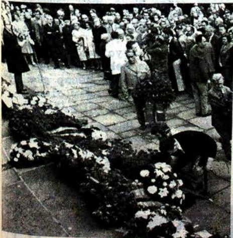
MALK FAŞİZMI TELİN EDİYOR !

Faşizmin toplumsal-ekonomik kökü olan emperyalizm, bugün özellikle az gelişmiş ülkelerde patronların sömürsünü devam ettirebilmek amacıyla ve demokratik ve sosyalist mücadeleyi bastırmak ve tüm halka zulüm yapmak için faşist idareler kurmak yoluna gitmektedir.