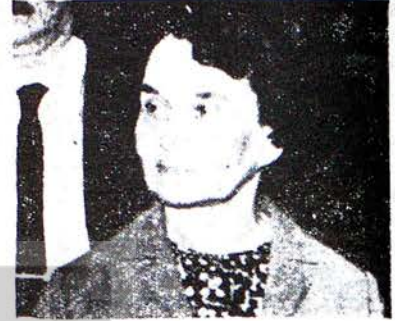
TIP GENEL BAŞKANI B. BORAN

Görülmüyor ki, iddianamenin aynı paragrafından aldığımız bu üç cümle, bir birinden tamamen kopuk kalmaktadır. Doğu bölgesinde Kürt halkının yaşamakta olduğunu söylemiş olmanın bu insanların komünist ihtilal için birmalzeme gibi istismar edilmesi sonucu nasıl çıkar, anlamak mümkün değildir.