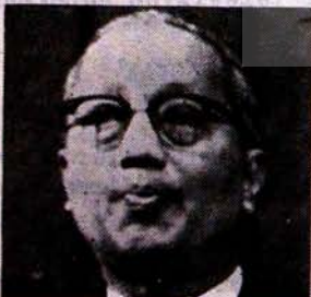
B.M. GENEL SEKRETERİ U THANT

Grev Londra'nın Babialı'si olan Fleet-Street'in patronlarının 107 000 üyeli Basın İşçileri sendikasının ücretlere %7,5 artış talebini reddetmesi üzerine başlamıştı. Sendika yöneticileri patronların baskılarına boyun eğmeyeceklerini belirtmişlerdir.