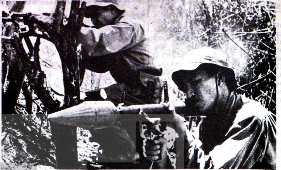
VİETNAM KURTULUŞ ORDUSUNUN TAARRUZUNDA İKİ YURTSEVER

Amerikan emperyalizmi son günlerde Hindičini'de ağır darbeler yemiştir. Güney Vietnam yurtseverleri 19 Eylül pazar gecesi Saygon'daki Amerikan cephanesini havaya uçurdular. 200 tonluk mermi ve şarapnel yok edildi, 220 düşman saf dışı edildi, 13 uçak ve helikopter düşürüldü. Son 12 gün içinde ise 3 000 düşman askeri öldürüldü, ağır yaralandı veya esir alındı, 20 uçak ve helikopter düşürüldü.