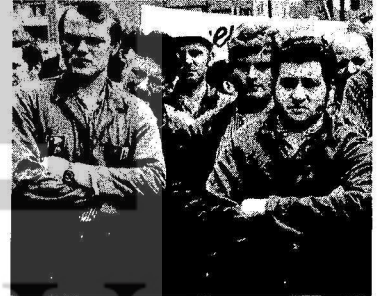
RESİM: KİMYA İŞÇİLERİNİN GREVİNİ GÖSTERMEKTE; BİNLERCE TÜRK İŞÇİSİ BU GREVE KATILMIŞTIR !

Bu fahiş kazançları bile az bulan Alman Para Babaları, işçileri, ve sendikalarını sin