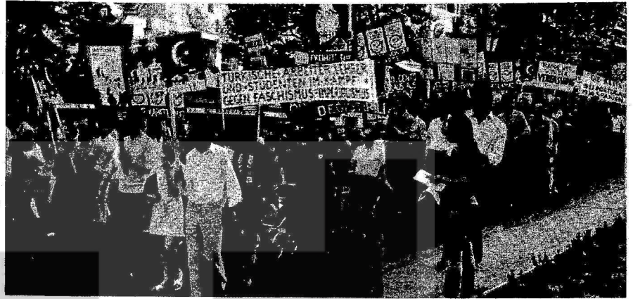
FAŞİST BASKILAR DİRENCİMİZİ KIRAMAZ, MÜCADELEMİZE ENBEL OLAMAZ

rının 12 bin 500 liraya çıkarılması Anayasaya aykırı olduğunu açıkladığı için kapatılmıştır.