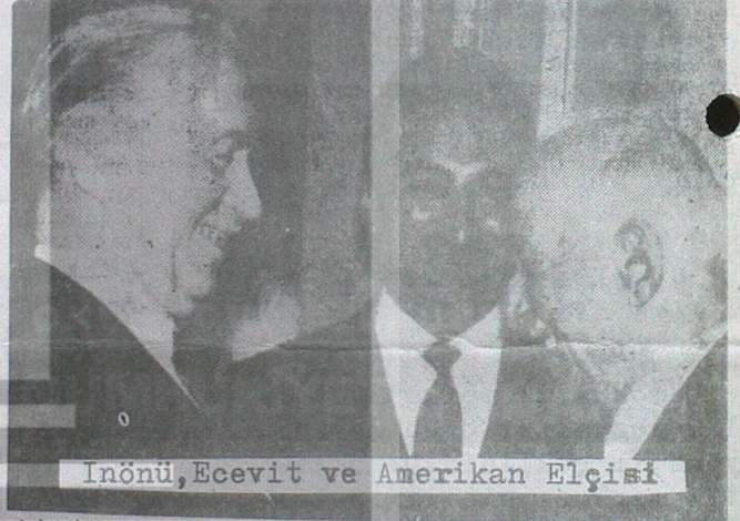
İnönü, Ecevit ve Amerikan Elçisi

Birinci cihan harbinden sonra emperyalist devletler başta İngiltere, Fransa, İtalya olmak üzere bir fiil memleketimizi işgal ettiler. Türk halkı işçisiyle, köylüsüyle, esnafıyla, memuruyla yediden yetmişe kadar silaha sarıldı ve emperyalistleri yurdumuzdan kovdu. Atatürkün önderliğinde verilen bu milli kurtuluş savaşından sonra cumhuriyet ilan edildi. Memleketimiz çok fakirdi. Büyük kapitalist devletler yalnız kendi menfaatleri için yardım etmeyi teklif ediyorlardı. Atatürk böyle yardımları kabul etmedi ve milli sanayimizi biz kendimiz kuracağız dedi. Memleketimizin birçok yerlerine dokuma, şeker fabrikaları kurdurttu. Atatürk zamanında kurulmuş olan müesseseler bugün dahi iktisadımızın temel taşlarıdır.