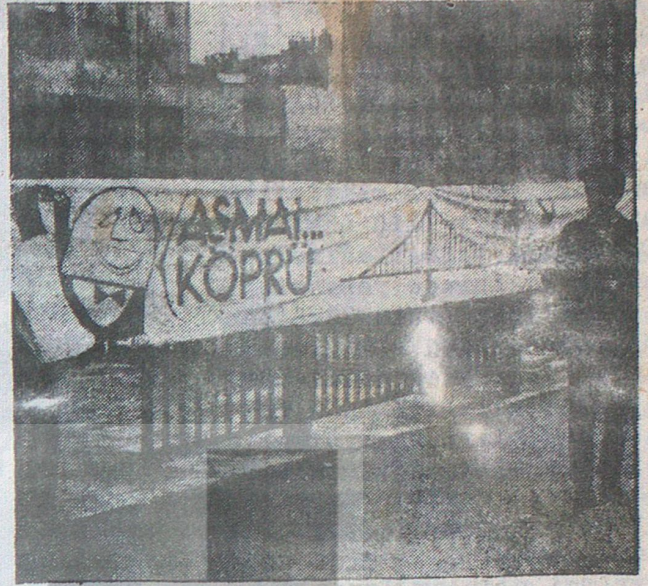
«KÖPRÜ» YERİLDİ — Teknik Üniversite Mimarlık ve Mühendislik Fakülteleri Öğrenci Birliği Başkanı, «Boğaz Köprüsü»nü yeren basın toplantısını yaparken..

Ve şimdi bu bozuk düzen 1970 yılında bir sürü yeni Deli Dumrul yaratıyor. Deli Dumrullar şirketler, hükümetler kurup, fakir Anadolu halkını, gidasızlıktan kötürüm kalan Doğu Anadolu çocuklarının ekmeğinden kestikleri yergilerle dev bir Deli Dumrul köprüsü yaptırıyorlar. Ama nereye? Sık sık taşıp yüzlerce insanın hayatına malolan geçit vermez Zap Suyu üzerine değil. Pırıl pırıl özel Amerikan arabalarıyla caka satmak isteyen bir avuç zengin için İstanbul Boğazına. Ve bu köprü'nün masrafları devamlı ihmal edilen Anadolu halkının vergileriyle ödeniyor. Dedikya, geçiş vergisini köprüden geçenden almak marifet değil. Geçmeyenden alacaksın ki milletin parmağı ağzında kalacak, ismin masallara geçecek