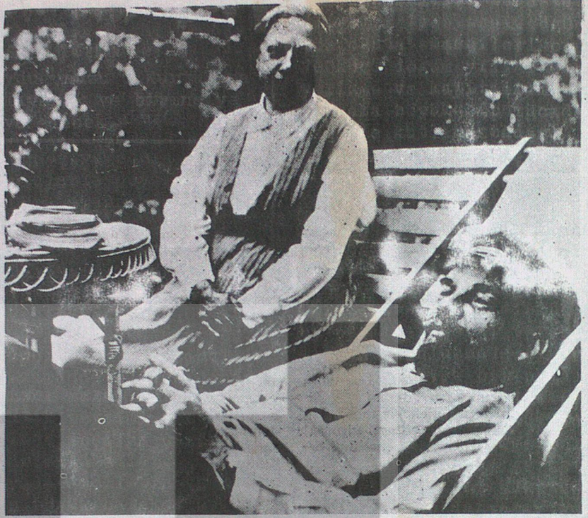
Lenin karısı Krupskaya ile birlikte

19. yüzyılın başında Rusya'da işçi hareketleri oldukça gelişmiş, Rus aydınları arasında Marksizm epeyce yayılmış ve birçok marksist dernekler kurulmuştu. Lenin bir birinden kopuk bu derneklerin devrimci bir parti halinde birleşmelerinin ve işçi sınıfının mücadelesinin bu parti tarafından yönetilmesinin gerektiğini belirtti, bu partinin kurulması için yıllarca savaştı. Lenin marksizmi iyi bilmesi, Rusya şartlarına ustaca uygulaması ve iyi bir teşkilatçı olması sayesinde Rus marksistlerinin yönetmeni oldu ve işçi sınıfının tarihi rolünü onların gözleri önüne serdi, işçi ve köylü ittifakı olmadan çarlığın ve burjuva iktidarının yıkılamaya çağını belirtti.