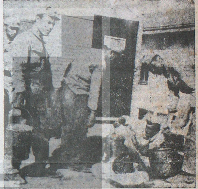
Çorlu'daki Sıhhi Tesisat Ekibini Amerikalıların pisliğini temizlerken gösteren «belge fotoğraf»

li anlaşmalar zincirinin günbegün sıkılması ve çekilmez hale gelen Amerikan şımarıklığı Türkiyenin onurunu daha ne kadar aylar altına almaya devam edecektir.