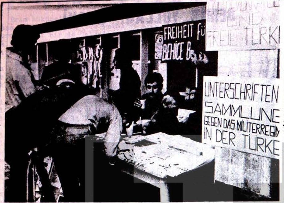
BATI BERLIN DEMOKRATİK-HÜR TÜRKİYE CEPHESİNİN GİRİŞTİĞİ EYLEMLER BASINDA DA YANSIMAKTADIR. RESİMDE FAŞİZME KARŞI İMZA TOPLAYAN, AFİŞ VE BROŞÜR SATAN İŞÇİ VE ÖĞRENCİLER.