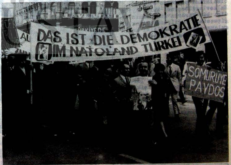
CUNTACI PAŞALARIN KUKLA HÜKÜMETİNE, EMPERyalizme ve FAŞİZME KARŞI MÜCADELE YURTDIŞINDA ve YURT DIŞINDA GÜÇLENMEKTEDİR. RESİM:FRANKFURT KARDEŞ ÖRGÜTÜ FAŞİZMİ PROTESTO YÜRÜYÜŞÜNDE

Yasasın TIP'liler! Yaşasın faşizme karşı birleşenler!"