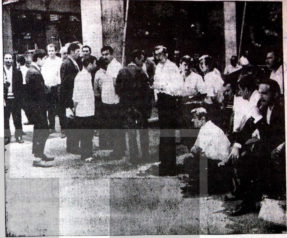
İki aydanberi ücretlerini alamıyan işçiler, işverenin kapısında beklerken

Çiney Anadolu Bölgesinin en büyük sanayi işletmesi ve Amerikan şirketlerine ait olan ATAS rafinerisinde işçilerin başlattığı grev hükümetçe milli güvenliğe aykırı gerekçesiyle ertelenmiştir. Amerikan sermayedarların indadına koğan hükümetin grevi milli güvenliğe aykırı olduğundan değil Amerikan sermayedarların çıkarına aykırı olduğu için ertele-diği apaçık ortadadır. Faşist Erim hükümeti iktidara geldiği günden bu yana bütün işçi grevleri milli güvenliğe aykırı gerekçesiyle ertelenmiştir. Fakat bu baskılar ve terörler işçi sınıfını mücadelesinden hiç bir zaman alakoyamayacaktır.