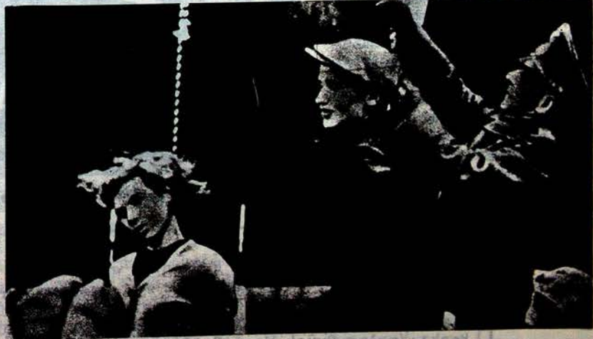
Bir SS-Gestapo tarafından asılan gençler.

"Halkın ve vatanın derdini halletme" kanunu çıkarılarak Hitler hükümetine, anayasaya uymasa da, meclisin tasdiğinden geçmeden kanun çıkarma yetkisi verildi. Faşistlerin bizzat kundakladıkları Meclis binası yanğını "Komünistler çıkardı" diyerek, bir gecede 10 000 ile ricci, demokrat ve sosyalist işçi, sendikacı, yazar, öğrenci ve profesör zindanlara atıldı.