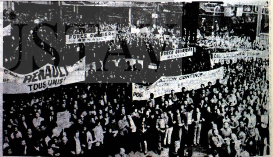
Grev yapan Fransız Renault fabrikası işçileri

Fakat şurası muhakkak ki, Birleşik Arap Cumhuriyetinin geleceğini ne büyük burjuvazi ne de onun sözcüsü olan gerici politikacılar tayin edecektir. Bunu tayin edecek tek güç Birleşik Arap Cumhuriyetinin kahraman halkı olacaktır. Bu halk yıllar süren mücadelelerden ve acı tecrübelerden sonra dostu düşmanı ayırtmayı çok iyi öğrenmiştir.