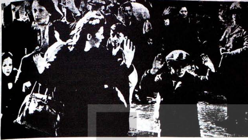
Faşizm milyonlarca sucsuz insanın, çocuğun, kadının ölümü demektir. Resimde sucsuz kadınların ve çocukların Alman SS-leri tarafından kurşuna dizilisi görülüyor.

Birinci emperyalist dünya savaşı (1914-18) sonra Almanyada kapitalist düzenin genel krizi boy gösterdi. Yeni kurulan Alman Cumhuriyetinin burjuva hükümetleri peşpeşe devrilirken, milyonlarca işsiz Arbeitsamt kapılarında kuyruğa girmekteydi. Alman parasının değeri hızla düşmeye başlamıştı. İşçinin aldığı ücret ekmek parasına yetmiyordu. Yarım yüz yıldan beri verilen amansız mücadelenin sonunda, emekçilerin alman patronlarından zorla kopardıkları demokratik ortamda, işçi hareketleri hızla gelişmekteydi. Dev grevler, mitingler, yürüyüşler birbirini kovalıyordu. Alman tekelci patron sınıfı, halkı soyup sömürme politikasını bu gidişle devam ettiremeyeceğini gördü.