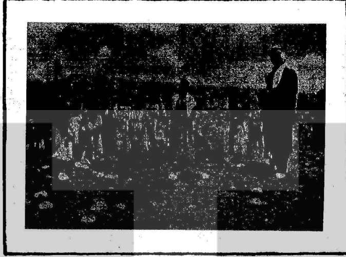
MİLYONLARCA ÇOCUK, BAYRAMI BÖYLE KUTLUYOR

23 Nisan Türkiye halkının "Ulusal Egemenlik ve Çocuk Bayramı" diye söylenir. Ellibir yıl önce emperyalizme boyun eğmeyi kabul etmeyen Türkiye halkı, düşünene uşaklık eden, emperyalizm in kuklası haline gelmiş olan Padişahın ve onun emrindeki Hükümetin karşısına dikildi. ve "Hakimiyet kayıtsız şartsız milletindir" diyerek Büyük Millet Meclisini ilan etti. Bunun ardından gelen yıllarda Halkımız, M. Kemal Önderliğinde amansızca savaşarak emperyalistleri uşaklarıyla birlikte koğdu. İşte 23 Nisan bu çetin savaşın dönüm noktasıdır. Bir de yurdumuzun bugünkü haline bakalım: Emperyalizmi yurdumuzdan koğmuş olan kahraman Tür