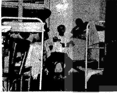
KÖŞKLERİN PARASINI BU İŞÇİLER ÖDER

İşçi ateşeleri makamlardan ayrılıp işçi sorunlarına eğilsinler. Onlar bu sorunların halli için buraya gönderildiler, Turistik seyahat için değil.