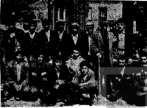
Müteahhit tarafından paraları verilmeyen işçiler toplu halde

Varto ve Erzurum'un çeşitli köylerinden olup açlığın ve ağa zulmünün İstanbula gelmeye zorladığı 25 köylü vatan - daş, bir müteahhitten Kâğıt - hane belediyesi kanalizasyon inşaatında 30 lira gündelikle iş almışlardır. Yazılı bir anlaşma yapmadan işe başlayan işçiler 4 ay hiç para almaksızın çalışmışlardır. İş bitince Müteahhit ortadan kaybol - muştur. Oturdukları barakanın kirasını ve 4 000 lira bakkal borcunu ödeyecek paraları olmayan işçiler karakola müracaat ederek, paralarını ödemediği kaçan Müteahhitin bulunmasını istemişlerse de Karakoldan kovulmuşlardır.