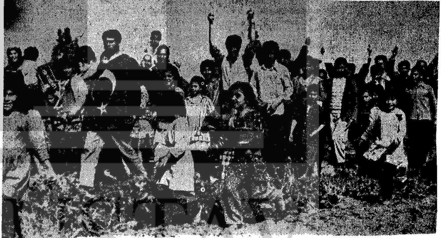
Ceyhan'ın Sarıbahçe Köylüleri Toprak İsteme Yürüyüşünde

Ereğli Demir Döküm Fabrikasında çalışan 4370 işçi adına yeni toplu sözleşme görüşmeleri 20 Nisanda başlamıştır. Daha önce haberini verdiğimiz gibi işçiler bu iş yerinde aylar süren sendikal mücadelelere girişmişler, kendilerini yıllarca patrona satan sarı sendika Metal-İş'i yapılan bir referandumla bağlarından atarak ezici bir çoğunlukla DISK'e bağlı Maden-İş'e girmişlerdir. Maden-İş öncülüğünde şimdi işçiler çok güçlü olup, patrone birçok haklarını koparacaklarından şüphe yoktur.