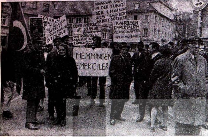
Memmingen'de Bir Mayısı Kutlayan Türkiyeli İşçiler

1 Mayıs bütün dünyada işçi bayramı olarak kutlanır. Hatta, Türk-İş sendika konfederasyonunun üyesi olduğu (Hürdünya Sendikalar Birliği) bile 1 Mayıs'ta bildiriler yayınlar. Türk-İş ise bağlı olduğu uluslararası örgütün bayram saydığı günü bile kutlamaktan kaçınacak kadar işçi sınıfına ihanet çizgisi üstünde kalır.