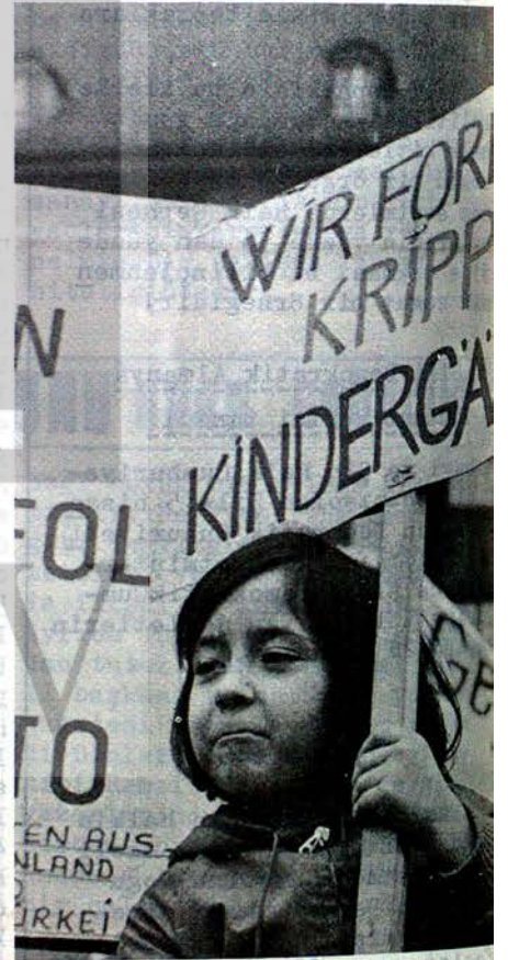
Bir Mayıs'ta bir Türk Çocuğu

Türkiye'de KURTULUŞ onbeş günlük işçi gazetesi-sayı 30 Sahibi:Avrupa Türk Toplumcular Federasyonu.Sorumlusu C.Nalçalı Yazışma adresi :Türkiye'de Kurtuluş-TTO,1Berlin 21,Bandel str1 Fiatı : 60 kuruş - 20 Pfennig- Yıllık Abone 20 T.L.-6 DM Baskı:Verlag-Druck West-Berlin,1 Berlin 31,Pfalzburger str. 20