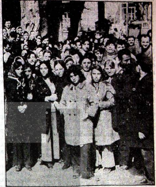
İşçiler işgal ettikleri TEKSİF Sendikası önünde

Bakırköy Enboy yün ipliği fabrikasında çalışan binden fazla işçi yeni plu sözleşme yetkisinin daha önce istifa ettikleri sarı sendika teksife verilmesi üzerine makinaları durdurmuşlar ve eturma grevine geçmişlerdir. Daha sonra gece vardiyesinde işe gelen işçilerle beraber Teksif sendikasının Cağaloğlundaki şubesini işgal etmişlerdir. Coğunluğu kadından olan işçileri bu kararlı direnişi karşısında patron boyun eğmiş ve işçilerin istediği DISK'e bağlı TEKSTİL sendikasıyla toplu sözleşmeyi yapmayı kabul etmiştir.