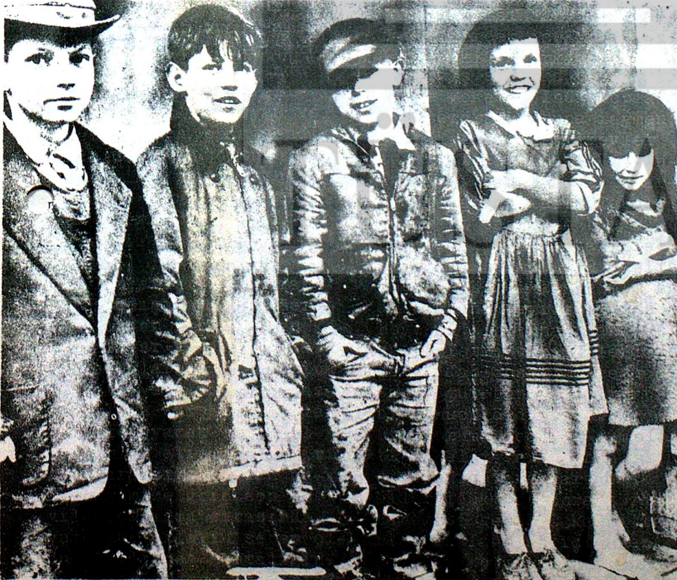
Amerikan Birleşik Devletlerin de maden ocaklarında çalışan işçilerin çocukları

Amerikanın en büyük tekelinden biri olan GENERAL ELEKTRİK'in 150 fabrikasında, çalışan 154 bin işçi 3 aydan beri grev yapmaktadır. Yine Amerikan Birleşik devletlerinin en büyük ve 84 bin işçinin çalıştığı Boeing uçak fabrikasından da 18 bin işçinin işine son verileceğini Amerikan haber ajanları vermiştir. Kapitalist ülkelerde her geçen gün daha açıkça beliren iktisadi krizler Amerikada da kesinlikle ortaya çıkmaktadır. Para babaları milyonerler kendilerine göre bu krizlerin önlenmesi için harb sanayinin büyü-tülmesi, Vietnam harbine devam edilmesi, Arap-İsrael harbinin körüklenmesi gibi yollar göstermektedir. Fakat Amerikan işçi sınıfı kapitalistlerin bu oyununa hiçbir zaman gelmeyecektir.