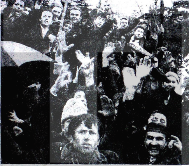
HAKLARI ÇİĞNENEN GAMAK İŞÇİLERİ — Tabii ki boyun eğip susmayacaklardır —

Gamak Elektrik Motorları Fabrikası patronunun hammadde olmadığı gerekçesiyle, 350 kadar işçiyi işten atmak için izin veriyor. 22 Aralıkta izinden dönen işçiler, fabrikada ellerinde bildiriler olduğu halde iktidarın polisini karşılarında görüyor. Polis tarafından dağıtılan bildiride 124 işçinin işten atıldığı ve diğer işçilerin de aralık ayına ait 15 günlük yemiyeleri, patronun istediği bir günde verileceği belirtiliyor. İşveren daha sonra kurmuş olduğu "kanlı tuzakı" gerçekleştirdi.