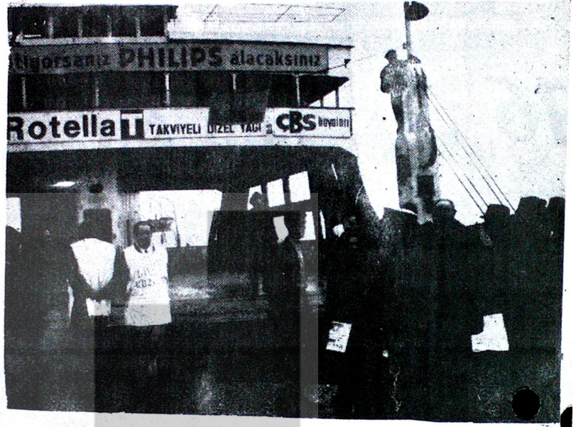
Istanbulda Deniz Taşıt işçilerinin grevinden bir görünüş

Bu yerinde ve bilinçli direnme Deniz taşıt işçilerine tatil günlerinde ücretlerini almaya hak kazandırdı. Sendika ve örgütlenmenin işçi için en doğru yol olduğunu, işçinin haklarına birleşerek ulaşabileceklerine güzel bir örnek verdiler. Varolun Türk denizcileri varolun taşıt isçileri!!!!