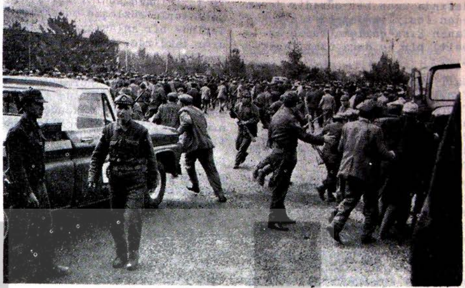
KANUNİ OLARAK İŞ İSTEYEN BATMAN'LI EMEKÇİLERİ DİPÇİKLEYEN JANDARMA LAR

:Toplam saat ücretlerine 250 kuruş zam, fazla mesai lere % 75 zam, 45 günlük izin gideri, 60 günlük ikramiye, 600 lira yakacak parası.