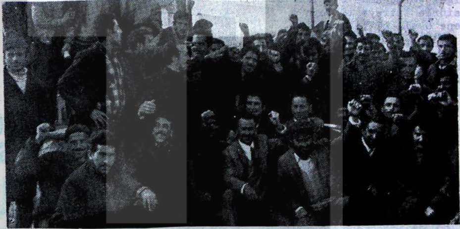
İŞTE DİRENEN EĞE DEMİR SANAYİNİN DEVRİMCİ İŞÇİLERİ

Süperlit boya fabrikaları işçileri patronun sarı sendika Çimse-İsle toplu sözleşmeyi yapmasına karşı bir aydan beri grevededirler.