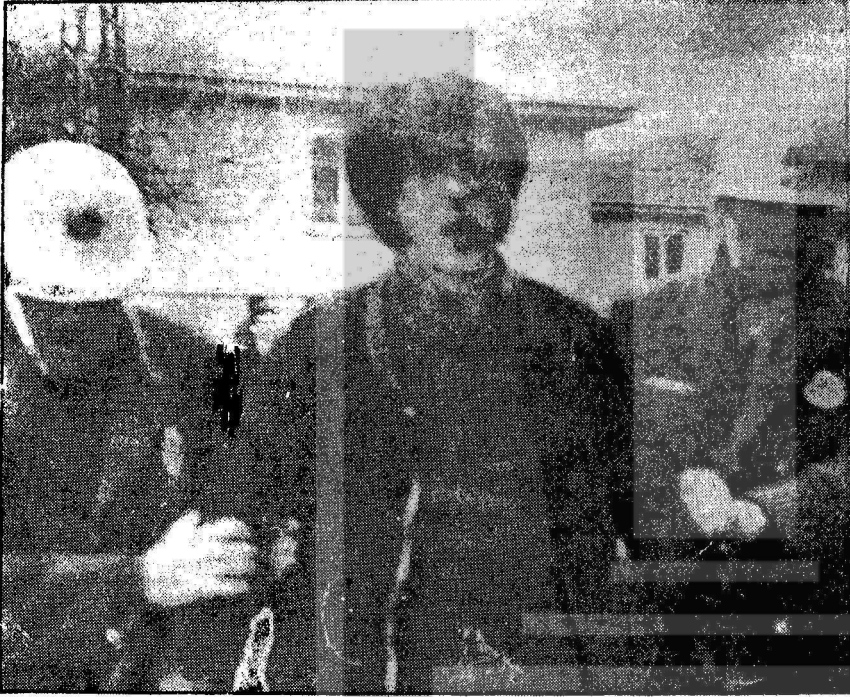
POLİSLER, KOMANDOLARA DEVİRDÜKLERİ BİR GENÇİ GÖTÜRÜYOR

İşçiden köylüye, esnaftan öğretmenlere kadar Türkiye emekçilerinin bütün çevrelerini saran direnme karşısında hükümet korkunç bir teröre girişmiştir.