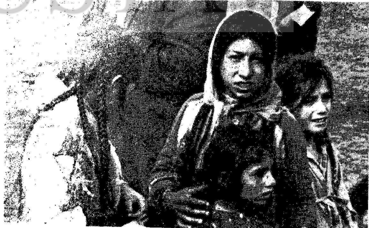
KOMANDO ZÜLMÜ ALFINDA İNLEYEN DOĞULU ÇOCUKLAR

Yurdumuzun her yanında toprak işgalleri yayılmaktadır. Son olarak KUYUCAK-a bağlı Karapınar köyünde topraksız köylüler 1500 dekar araziye işgal etmişlerdir. Köylüler işgal ettikleri toprağı temizleyip ekilebilir hale getirmiş ve sahip çıkmışlardır.