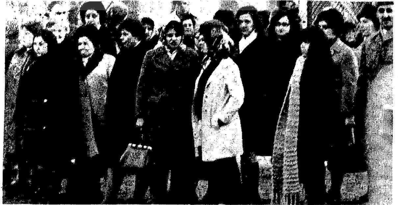
SIEMENS İŞÇİLERİ : İŞ GARANTİLERİ VARMİ ?

FEDERAL ALMANYA VE BATI BERLİN HÜKÜMETLERİNİN TURİST İŞÇİLERİ AF ETMİYECEKLERİNİ BİLDİKLERİ HALDE YALAN BRYANLAR VEREREK ON BİNLERCE TÜRKİYELİ İŞÇİNİN BURALARA GELİP AÇ BİLAÇ SEFALİTE DÜŞMELERİNE SEBEP OLANLAR, ÇALIŞMA BAKANI SİYFİ DEMİR-SOY VE DEVLET REİSİ CEVDET SUNAY' DIR. FEDERAL ALMANYA VE BATI BERLİN' DE İŞSİZLİK SÜRATLE ARTARKEN, SİYFİ DEMİR-SOY HÂLA YALAN BRYANLARLA TURİST İŞÇİLERİ ALDATMA ÇABASI İÇİNDE DİR.