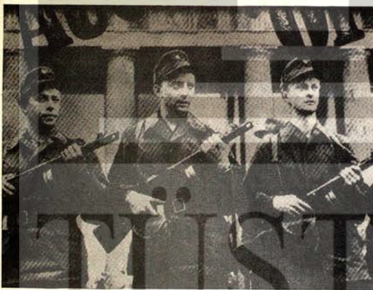
13 Ağustos 1961 günü şafak saatlerinde Alman Demokratik Cumhuriyeti işçi milisleri Batı-Berlin sınırını güvene altına aldılar.

Halktaki demokratik, barışçı istemler o kadar güçlüydü ki, gerici Adenauer'in parti- si CDU bile programına «savaş suçlusu te- kellerin mallarının devletleştirilmesi» iste- mini almak zorunda kalyordu. Adenauer, Almanya'da 1 Ocak 1947'de tüm savaş en- düstrisinin safdışı edilmesi, tamamen silah-sızlanmasını istemek ve hatta boşluğu konus- mak zorunda kalyordu: «Evet, ben hatta daha ıleri gitmek istiyorum. Alman halkının