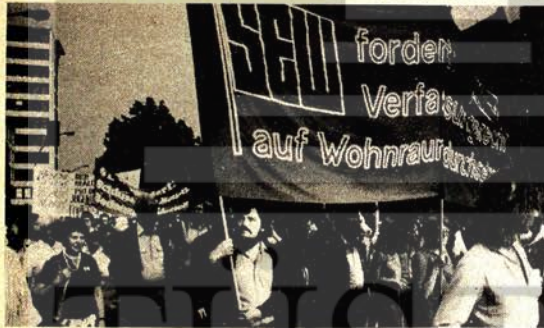
Batberlin Sosyalist Birlik Partisi sosyal konut politikası için savaşıyor.

misinin parklarına bırakılmıştır. Bugün F.Almanya, yapı endüstrisi dalında teknik yönden çok sayıda modern ve iyi döşeli ev yapma olanığına sahiptir. Ancak tüm bu olanaklara karşın yeni yapılan ev sayısında her yıl azalma izlenmektedir. 100 binin üzerinde yapı işçisi işsizdir. 80'li yılları başında 1,2 milyon konut eksikliği vardı.