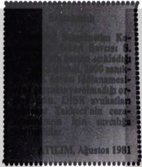
12 Eylül, Ağustos 1981

Türkiye'de de Amerikan uşaklarının bombayı aklamak, İler Türkmen'in bu bombanın Türkiye'de de yerleştirilebileceği gerçeğini örtbas etme çabalarına karşın, protestoları yükseldi. Basında bu konuda yer alan bazı gerçekçi yazarların yazılanları bülümleri okurlarımıza 3.sayfada sunuyoruz.