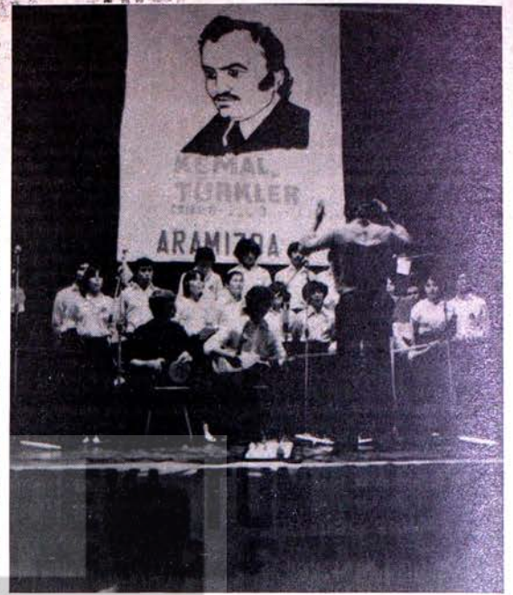
Wiesbaden'da düzenlenen anma toplantısında koro ve ozanların katıldığı geniş bir kültür programı yer aldı.