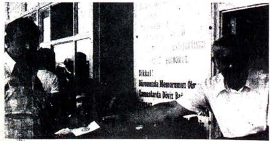
Ozal işçilerimizin dövizlerini karşılıksız paraıyla ellerinden aldı

İzincinin bu yıl da parasını almak için her yola başvurular. Bu yıl da izin dönemi TL'nin değeri suni olarak yüksek tutuldu, izincinin dövizini karşılığın altında elinden alındı. Yalnız bununla yetinmediler, "kağıt para" yetiştiremediklerinden bir kaç haftada 60 milyar TL karşılıksız para basıp piyasaya sürdüklerini açıkladılar. Şimdi izin döneminin izleyen aylarda yeni bir devalüasyon geleceği söylentileri başında çıkan yorumlarda yayılmaya başladı. Bu büyük