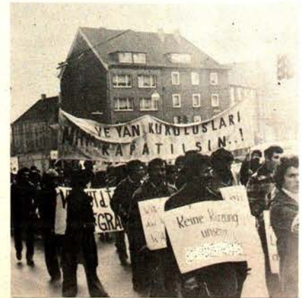
Yurt dışındaki işçilerimiz faşist MHP'ilerin hak ettikleri en ağır cezaya çarptırılmaları için sesterini yükseltiyorlar.

İlerici güçlere saldırı en gerici çevreler ne yapmak istiyor? Birincisi, bu çevreler MHP davasını açan askersel savcının "MHP, Türkiye'yi komünist saldırı ve düzenen kurtarmak maskesi altında cinayetler işleyen bir cetedir" yargısını sürdürmeye, ülkede "komünizm tehlikesi"nin varlığını sözde kanıtlamaya çalışıyor. Böylece, MHP'nin cinayetleri-haklı gös-