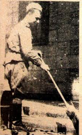
Berlin, Mayıs 1945: Bir Sovyet askeri hükümet binası merdivenlerinde Nazi madalyalarını süpürüyor.

İkinci Dünya Savaşı'nın ikinci yılında yapılan bu saldırının amacı faşist Almanya'ya yeni ve zengin hammadde kaynakları kazandırmak, «yaşam alanını» genişletmek ve sosyalizmin kalmasını yıkmaktır. Ayrıca faşist nazi ideolojisi Slav ırkını yoketmesi gereken «aşğılık» bir ırk olarak görüyordu. Böylece faşist Alman orduların sivil, asker, kadın, çocuk ayırımı yapmaksızın, taş üzerinde de bırakmayan canı bir saldırıya giriştiler.