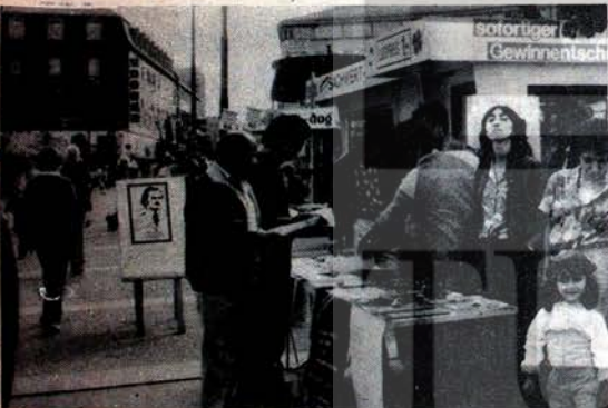
Kassel Türkiye İşçi ve Öğrenci Derneği 22 Temmuz'da Kemal Türkler'i anma gününde bir enformasyon standı açtı.

Belçika'daki Türkiye İşçiler Birliği Kemal Türkler'in katlinin 1.yıldönümü ile ilgili bir bildiri çıkardı. Bildirinin bir bölümünde şöyle deniliyor: "Dünya demokratik güçleri, uluslararası sendikal hareket, halkımız DİSK'li sendikacıları ve zindanlarda yığılıca direnen ilericileri yalnız bırakmayacaktır. Kemal Türkler'in uğruna canını verdiği sınıf sendikacılığı yaşayacaktır. DİSK'e konan yasak, Türk-İş üzerindeki kısıtlamaları kaldırılmaldır! Abdullah Baştürk'e, demokratik sendikacılara, faşist ve Maoist teröristler dışında tüm politik tutuklulara özgürlük! Demokratların kovuşturulmasına, işkenceye son! Kemal Türkler'in katili MHP'ye ardındaki güçlerden hesap sorulsun !"