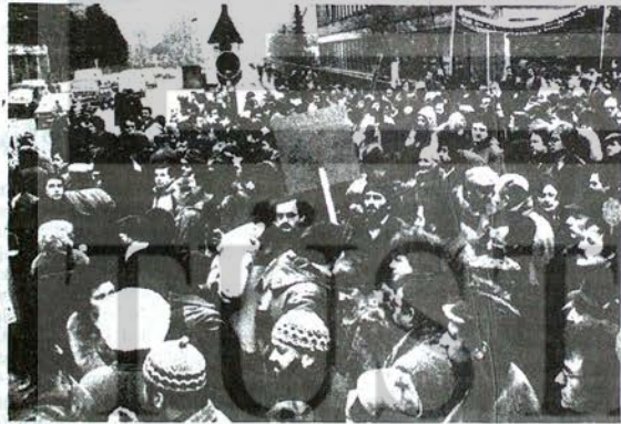
İşverenin dayattığı %3'lük ücret zammını protesto etmek amacıyla düzenlenen grevlerde Mercedes İşçileri yığınsal olarak katıldılar.

Batberlin'deki metal teklere 1975-1980 yılları arasında karlarını % 50'nin üzerinde daha fazla arttırdılar. Yine bu süre içerisinde üretimi % 29,5 arttıran, çalışan işçi sayısını da % 8,2 azalttılar.