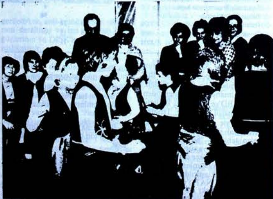
Batberlin Türkiye Kadınlar Birliği'nin yeni dernek yerinin açılışına Batberlin Sosyalist Birlik Partisi 2.Başkanı Bayan Inge Kopp'da(arka ortada) katıldı.

Halk sanatçısı Sümevra ve BTKB Çocuk Folklorü'nden oluşan kültür programından sonra konuklar, Birlik üyelerinin hazırladıkları ülkemiz yemeklerini yediler ve geç saatlerde kadın sohbet edildi, kadın sorunları tartışıldı.