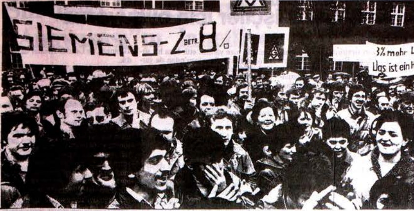
Siemens ve Osram'dan 3500 işçi yaptıkları uyarı grevinde %8'lik ücret zammı haklarını almakta kararlı olduklarını gösterdiler.