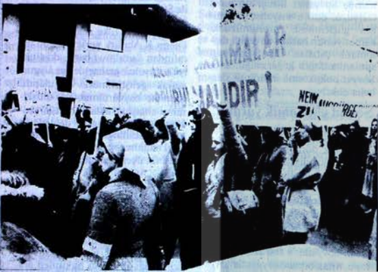
Aynı yürüyüşte askeri yönetimin demokratları sindirmek amacıyla uyguladığı vatandaşlıktan çıkarmalar da şiddetle protesto edildi.

- İşkencelere, yığınsal tutuklamalara derhal son verilmesini, yurtsever demokrat tutukluların serbest bırakılmasını istiyoruz!"