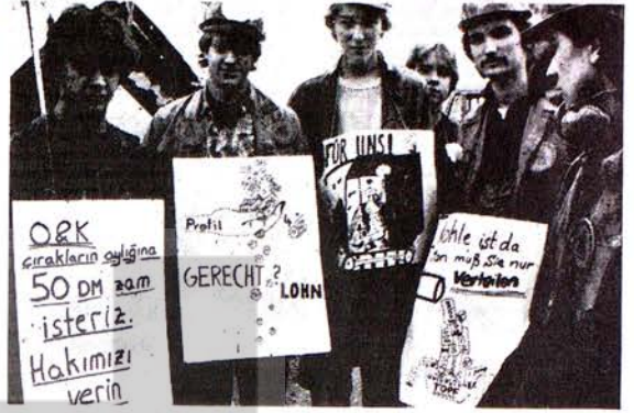
Batberlin Spandau Orenstein & Koppel işyerinden 1000 kadar işçi meslek öğretilerini yapan gençlerle birlikte grevlere katıldılar.

evet demek, çocuk-çocuk sefalet içinde yaşamaya evet demek olacaktır. Metal işçileri grevlerinde yerden göğe kadar haklıdır. İsteklerinde haklıdır. Tüm metal işçileri tekellerin ücret diktasına karşı güçlerini IG-Metall safalarında birleştirmelidirler. Diğer işkolundaki fabrika ve işyerlerinde çalışan işçi ve emekçiler metal işçileri ile aktif dayanışmaya girmelidirler. Bugün metal işçilerinin yürüttükleri bu ücret savaşımına bizler de sendikalarımız içinde hazırlıklı olmalıyız. Çünkü yarın bizim patronlarımız da bizlere %3, %4 ücret zammını dayatmak isteyecekler-