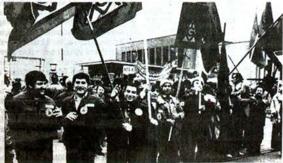
Yabancı işçiler de IG-Metall'in düzenlediği uyarı grevlerine aktif olarak katılıyorlar. Resimde AEG(Lahnstr.) işçileri görülüyor.

BEKUM fabrikasının satışları 1980'de ilk defa 100 milyon DM'ın üzerine çıktı. OSRAM son bir yıl içinde 1,3 milyar DM kar etti. AEG'nin 1980'deki net kan 200 milyon DM'tır. SIEMENS'in Batberlin'deki fabrikaların-