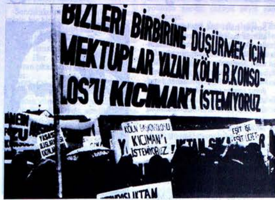
8 Mart Dünya Kadınlar Günü'nde Türkiye'li kadınlar Bonn Büyükelçiliği önünde Başkonsolos Kıcıman'ı protesto ettiler.

...Bugün Türkiye'deki binlerce tutuklu arasında bir çok yurtsever kadın da bulunmaktadır. Bunların bir kısmına çeşitli baskı ve işkenceler uygulanmaktadır. İKD Bursa şube sekreteri emniyet müdürlüğünde gördüğü işkence sonucu hala iç kanama geçirmektedir. Kendileri koğuşturmaya uğrayan kadınların dışında, bir çok sendikacı ve demokratik yığın örgütü yöneticisinin eşleri, çocukları da baskı görmüş ve