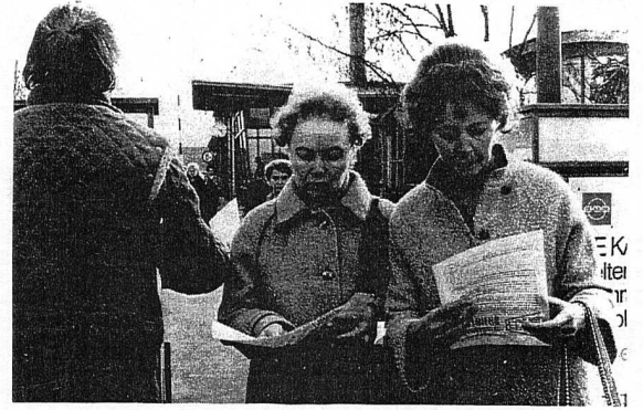
SEW ÜYELERİ BATİBERLİN PHİLİPS ÖNÜNDE BİLDİRİ DAĞITTIKLAR.

bir çözüm bulunmasını, yabancı düşmanlığa karşı savaşı içeriyor. Genel Kurul'da bu ve diğer konularda konuşmalar, tartışmalar yapılmıştır. Karar tasarıları oybirliği ile karara bağlanmıştır. Canlı ve coşku lu bir çalışmadan sonra Genel Kurul'a katılan delegeler ve gençler aynı gün "Türkiye İlerici Gençliğiyle Dayanışma" gecesine katılmışlardır. Enternasyonal dayanışmanın ruhunun ege men olduğu gecede bir de F.Almanya'da başlatılan gerici kampanyaların üçüncünü açığa vuran bir mektup katılanlar tarafından kabul edilmiştir. Mektup basına ulaştırılmıştır.