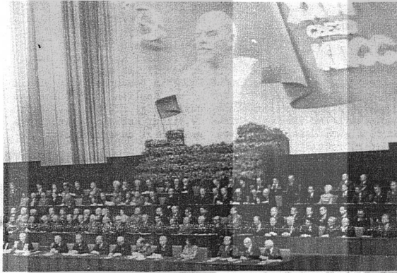
SBKP 26. KONGRESİ TÜM HALKLARA BARIŞ YOLUNU GÖSTERİYOR.

SBKP Genel Sekreteri L. Brejnev'in yaptığı somut barış