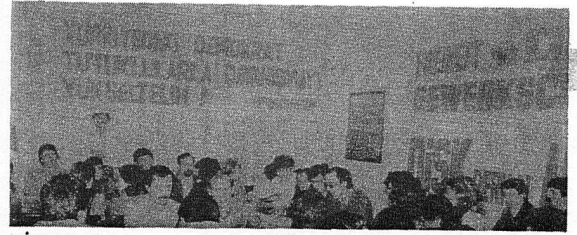
DİSK'İN 14. KURULUŞ YILDÖNÜMÜ COŞKUYLA KUTLANDI.

..Askersel diktatörlük özelikle DİSK'i saldırı hedefi seçti. DİSK kapatıldı ve 2500 yöneticisi tutuklandı. Genel Başkanı dahil işkencelerden geçirildi. 34 yöneticisini vatandaşlıktan atma kararı alındı.