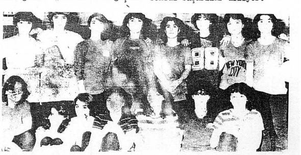
YUKARIDA BOĞAZİÇİ SPOR MERKEZİ'NİN KIZ VOLEYBOL TAKIMI GÖRÜLÜYOR. BOĞAZİÇİ'NİN BUNDAN BAKA BİRDE FUTBOL TAKIMI VARDIR.

İşte Boğaziçi Spor Merkezi'nden gençlerimizin başarılarını, karşılaştıkları güçlükleri böyledile getiriyorlar. Gazetemiz Kurtuluş spor yapabilmek için binbir güçlüklerle karşılaşan gençlerimize bu güçlükleri yemeyen yolundaki çalışmalarında sonsuz başarılar diliyor.