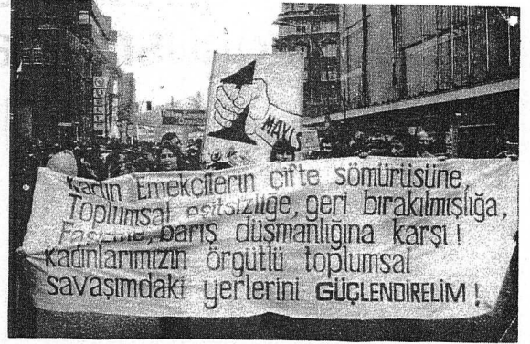
8 MART KADIN HAKLARI İÇİN SAVAŞ GÜNÜDÜR