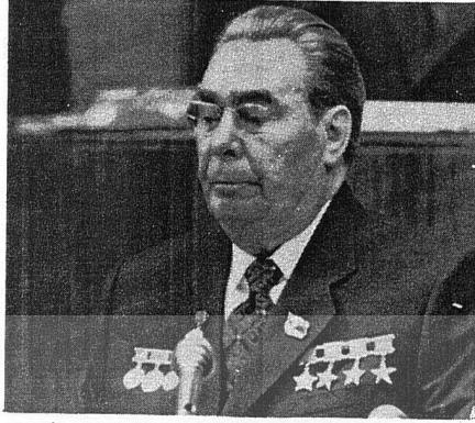
LEONİD BREJNEV KONGREDE KONUŞURKEN

Sömürgecilikten kurtulmuş ülkelerle Sovyetler Birliği arasındaki ekonomik ve bilimsel - teknik alanlardaki ilişkilerin gitgide geliştiğini belirten L. Brejnev bu konuda da şunları söyledi: "Biz devrim ihracına karşıyız, ama karşı-devrimin ihracına da izin veremeyiz. Emperyalizm Afganistan Devrimi'ne karşı resmen ilan edilmiş bir