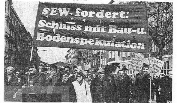
SEW BATİBERLİN'DE EMEKÇİLERİN GÜNCEL İSTEMLERİNİ DİLE GETİRİYOR.

emekçilerin haklarını ve çıkarlarını SEW'den başka hiç bir parti bu kadar ardıcıl savunuyor, dile getirmiyor. Batıberlinli çalışanların partisi SEW, Al-