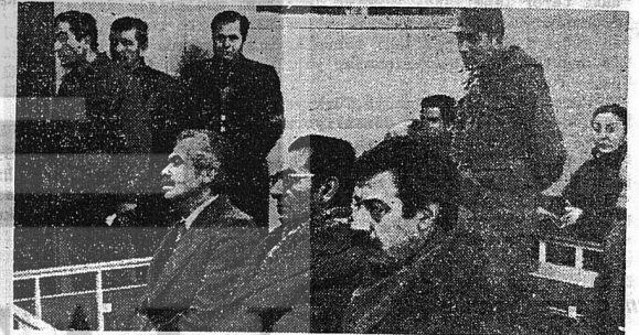
AVRUPA KONSEYİNDE SENDİKALAR ÜZERİNDEKİ BASKILAR KINANDI. RESİMDE DİSK YÖNETİCİLERİ DURUŞMA SIRASINDA GÖRÜLÜYÖRLER.

24 Ocak kararları adıyla bilinen,Özal'ın IMF programı 7 yılını tamamladı. Bu bir yıl boyunca sermaye çevrelerince ö ve öve göklere çıkarılan 24 Ocak kararları artan enflasyondan, paranın değerinin Amerikan Dolar'ı karşısında sürekli düşüşünden, milyarlarca ulusan dış ticaret açıklarından,yok-