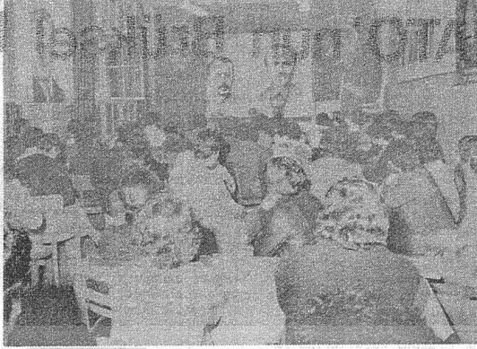
İŞÇİLERİMİZ 15'LERİ YIGINSA TOPLANTILARINA ANDILAR.

TKP'nin kurucusu, Türkiye işçi sınıfının yiğit savaşçısı Mustafa Suphi ve 14 yoldaşını Köln'de 24 Ocak Cumartesi günü coşkulu anıldı. Anma toplantısına Ford, Bayer ve diğer fabrikalarda çalışan 200'e yakın işçi ve emekçi katıldı. Toplantıda burjuvazinin işlediği alçakça cinayet anlatılarak, Onbeşlerin zorlu savaşını dile getirildi. TKP'nin 60 yıllık övgüverimli savaşını anlatıldı. Salon Onbeşler adına kızal bayraklarla donatıldı. Toplantıya ayrıca diğer ülkelerin komünist partilerinden temsilciler katıldılar.