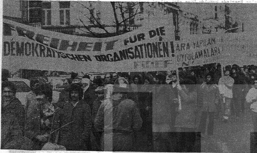
6 000' NİN ÜZERİNDE İŞÇİNİN KATILDIĞI KÖLN YÜRÜYÜŞÜ GÖRKEMLİ OLDU. YÜRÜYÜŞLE İLGİLİ DİĞER RESİMLERİMİZ 3. SAYFAMIZDA.

Tutuklamalara, baskılara, işkencelere karşı