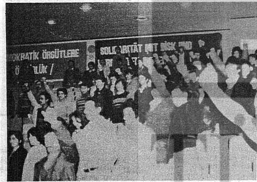
TÖB-B'Lİ ÖĞRENCİLER EYLEM BİRLİĞİNİ SAVUNDULAR.